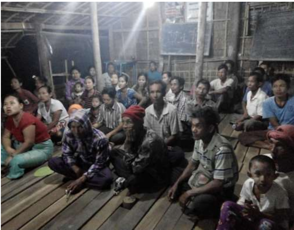
သာပေါင်းမြို့နယ် ၊ ထန်းတပင်ကျေးရွာအုပ်စု ၊ ထန်းတပင်ကျေးရွာတွင် အစည်းအဝေးပြုလုပ်ပုံ