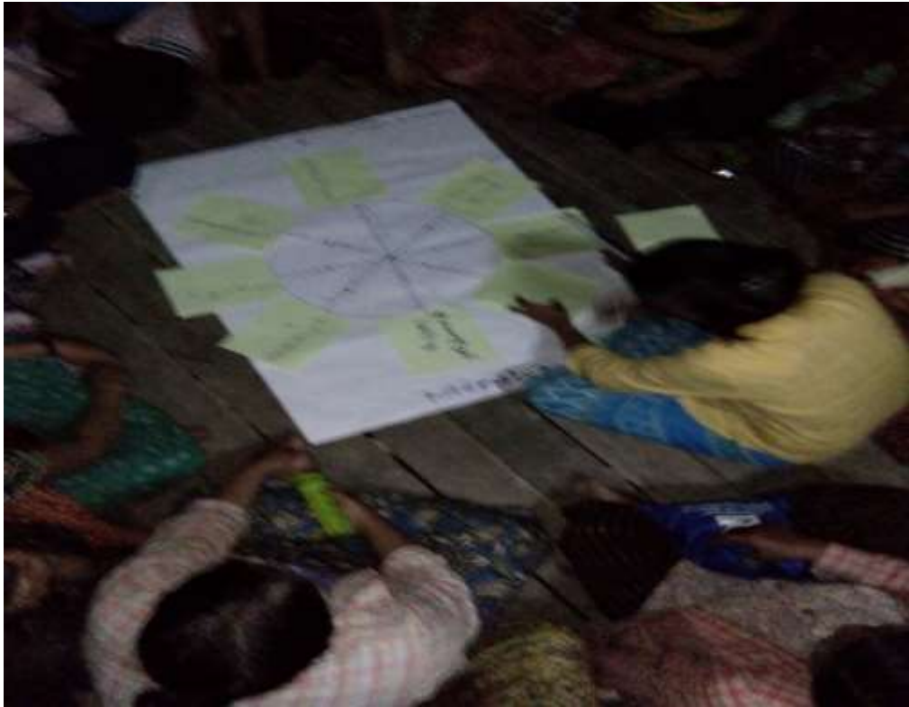
သာပေါင်းမြို့နယ် ၊ ထန်းတပင်ကျေးရွာအုပ်စု ၊ ထန်းတပင်ကျေးရွာတွင် PRA Tools များ ပြုလုပ်ပုံ