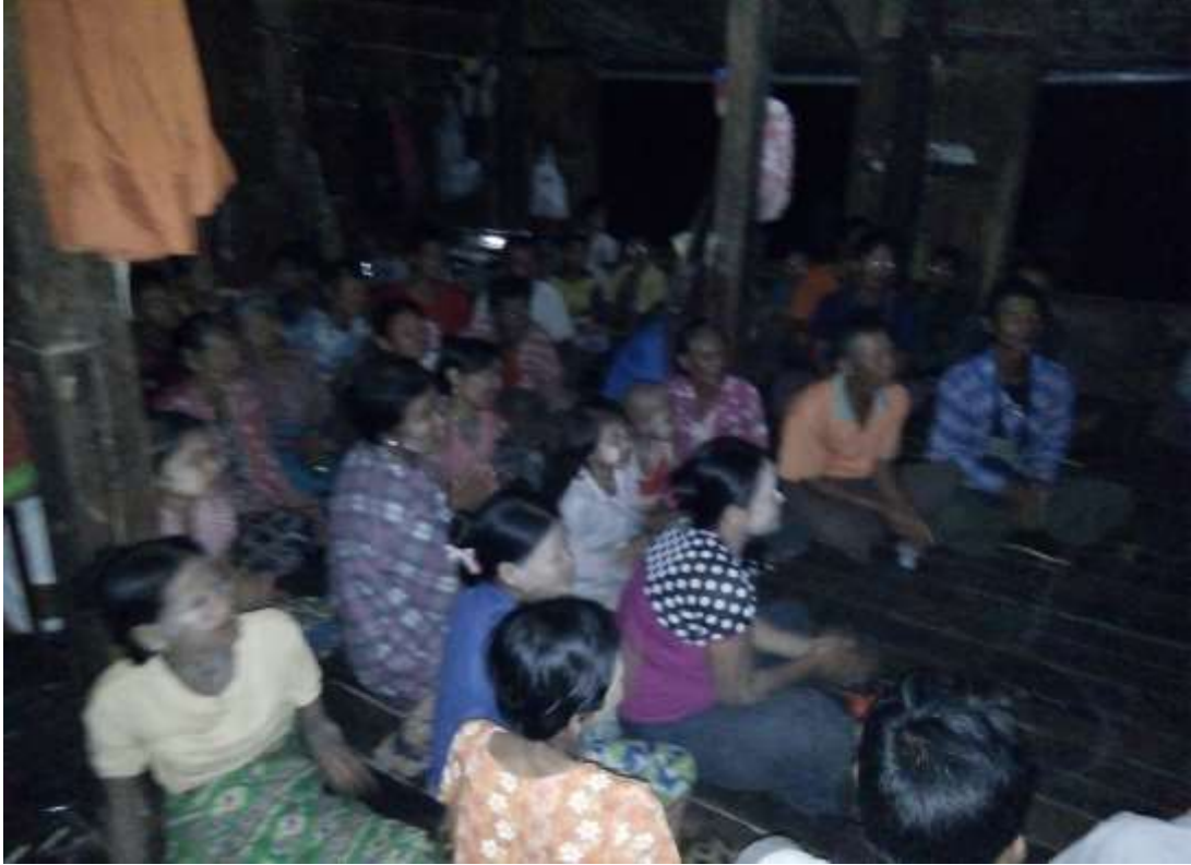
သာပေါင်းခြင်းအဖွဲ့အစည်းများ ၊ ထန်းတပင်ကျေးရွာအုပ်စု ၊ ထန်းတပင်ကျေးရွာတွင် အစည်းအဝေးပြုလုပ်ပုံ