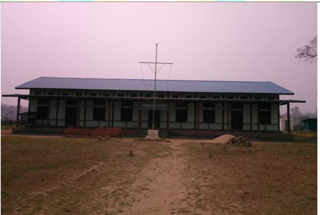
လုပ်ငန်းခွဲ၏မပြုလုပ်မီ မှတ်တမ်းဓာတ်ပုံ