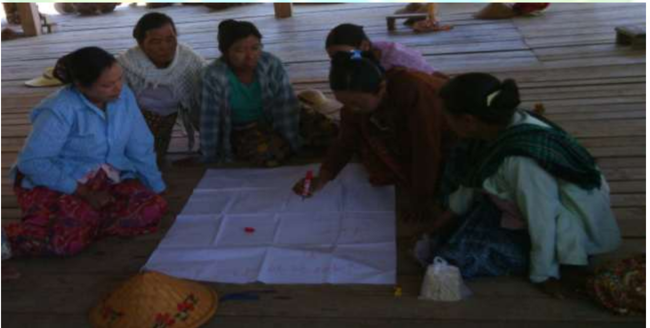
အမျိုးသမီးအုပ်စု၏ မှတ်တမ်းဓါတ်ပုံ