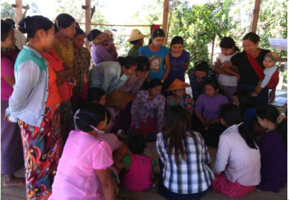
ကော်မတီရွေးချယ်ခြင်း မှတ်တမ်းဓာတ်ပုံ