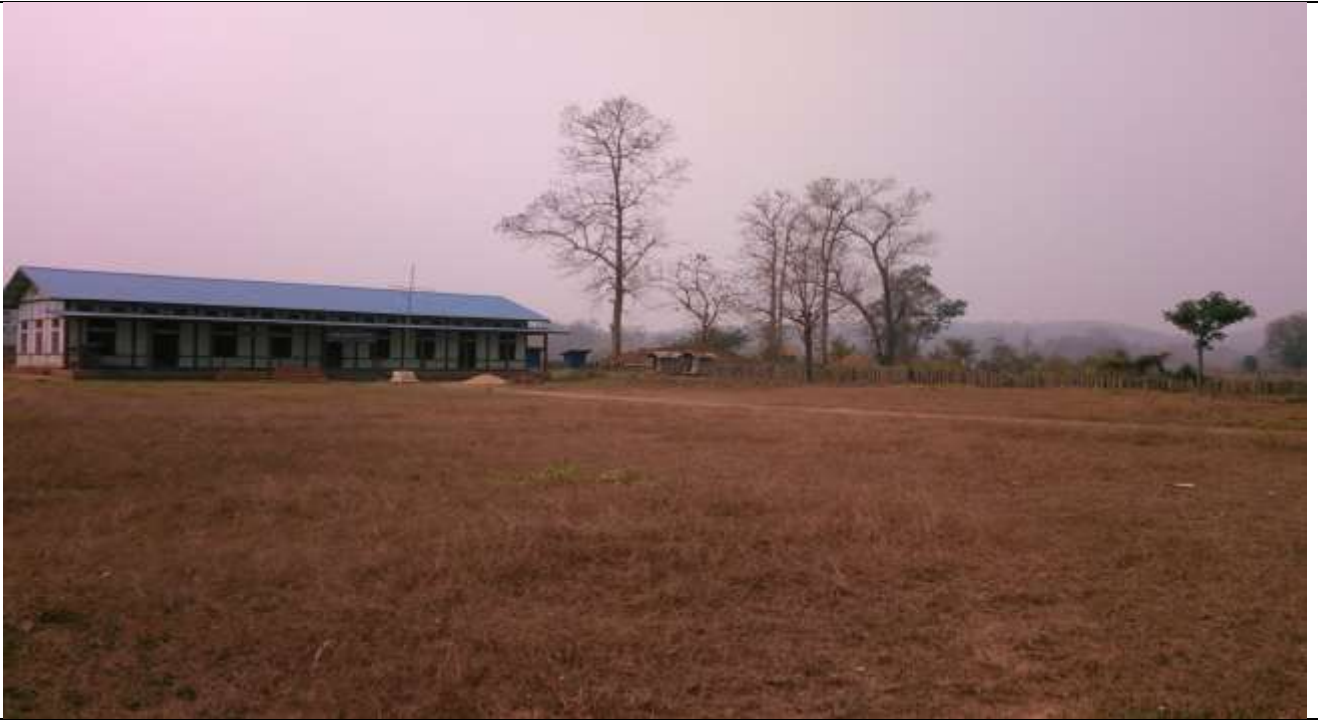
လုပ်ငန်းခွဲ၏မပြုလုပ်မီ မှတ်တမ်းဓာတ်ပုံ