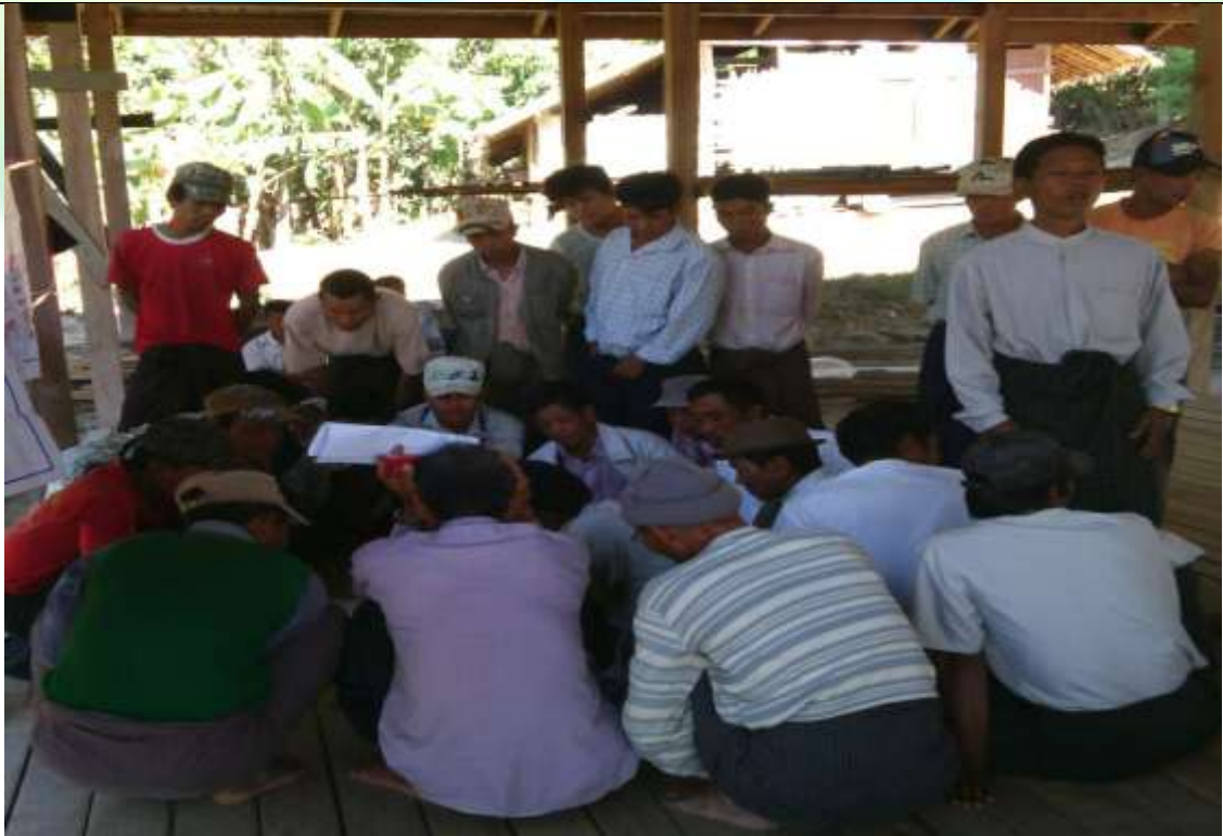
စေတနာ့ဝန်ထမ်းများ ရွေးချယ်ခြင်း မှတ်တမ်းဓာတ်ပုံ