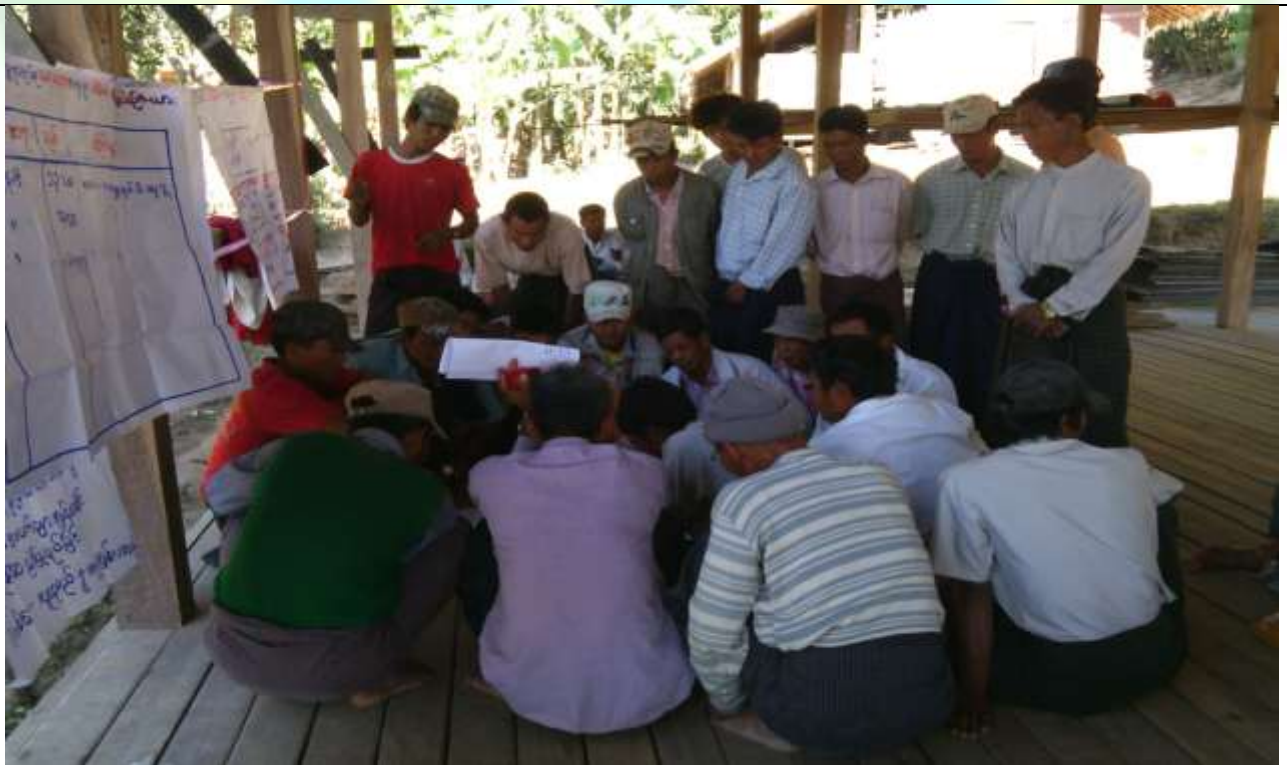
ထိခိုက်လွယ်အုပ်စုများ၏ မှတ်တမ်းခါတ်ပုံ