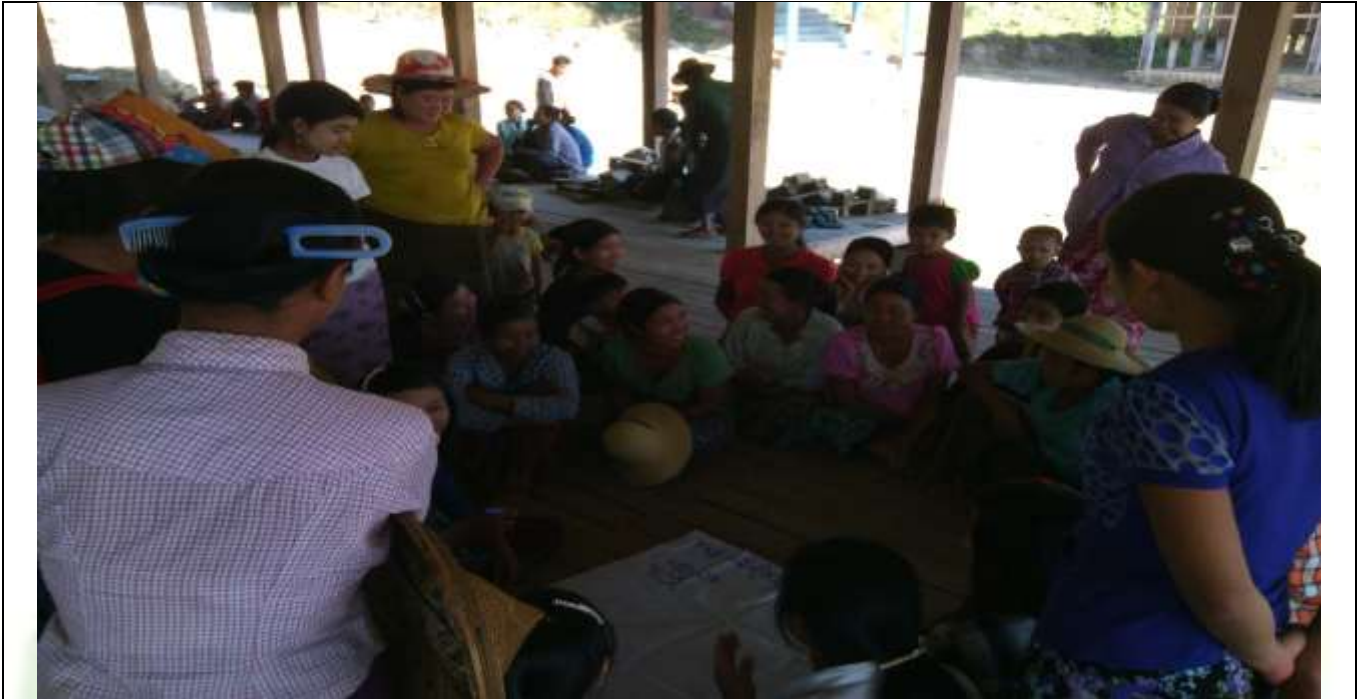
အမျိုးသားအုပ်စု၏ မှတ်တမ်းဓါတ်ပုံ