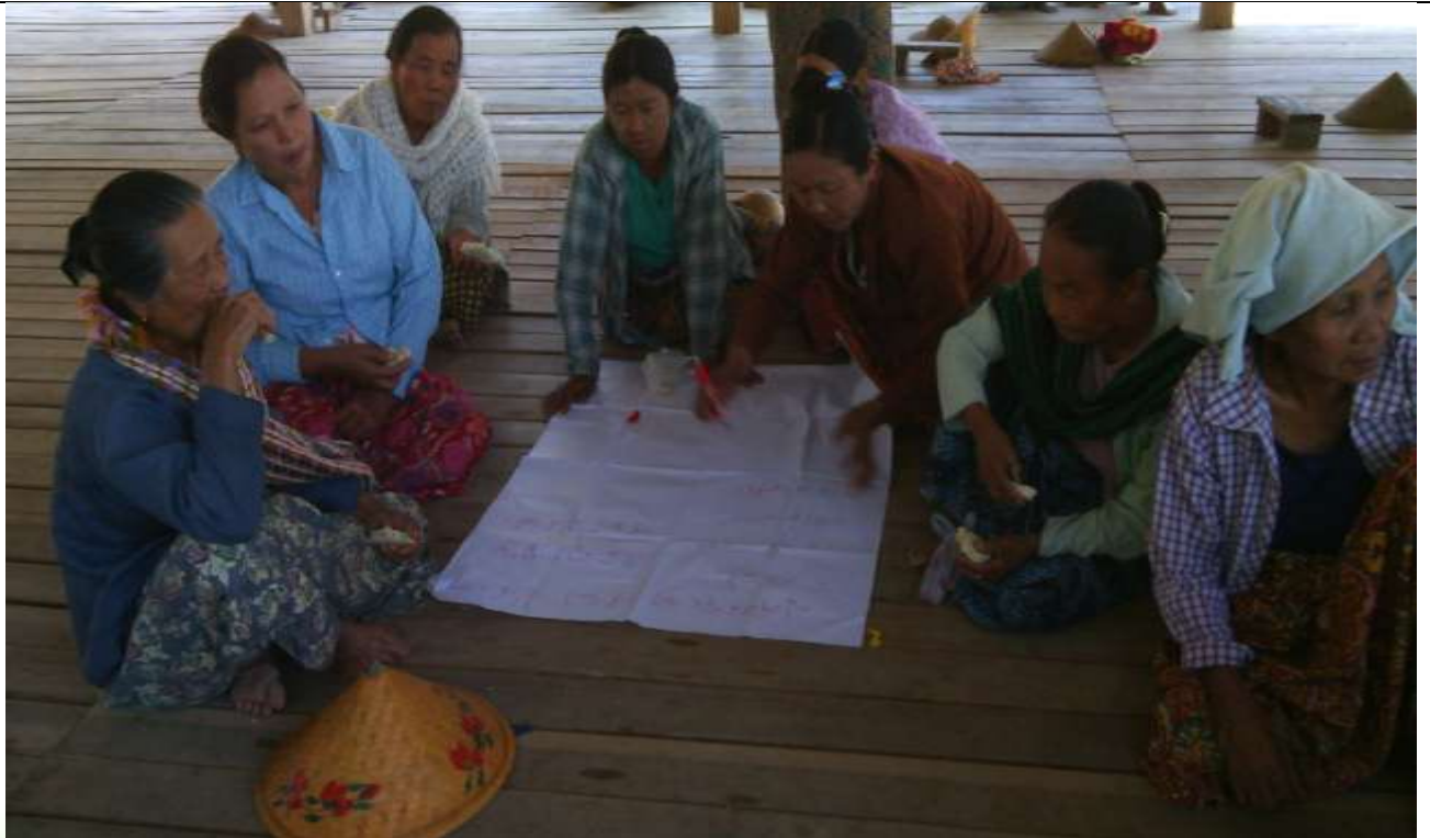
ဖွံ့ဖြိုးရေးအစီအစဉ်ရေးဆွဲခြင်း မှတ်တမ်းခါတ်ပုံ