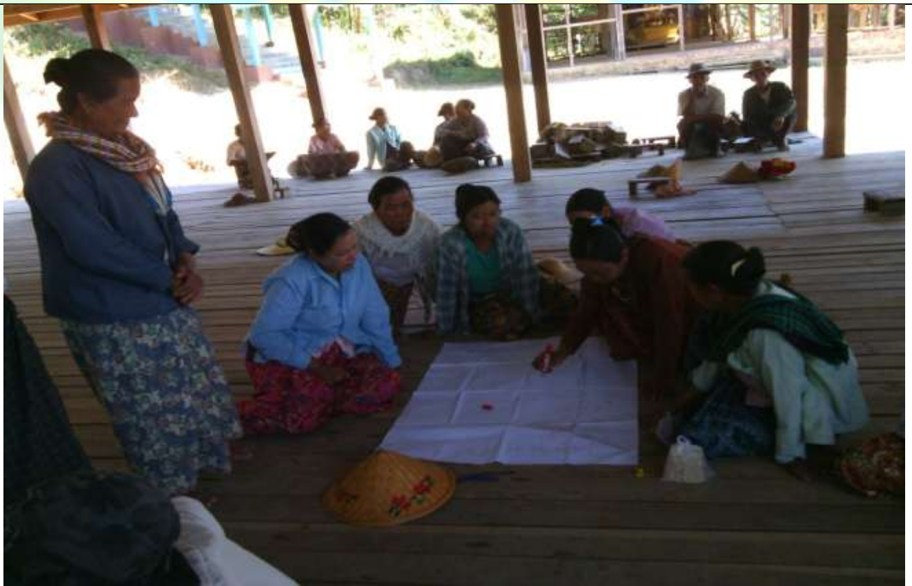
ဖွံ့ဖြိုးရေးအစီအစဉ်ရေးဆွဲခြင်း မှတ်တမ်းခါတ်ပုံ