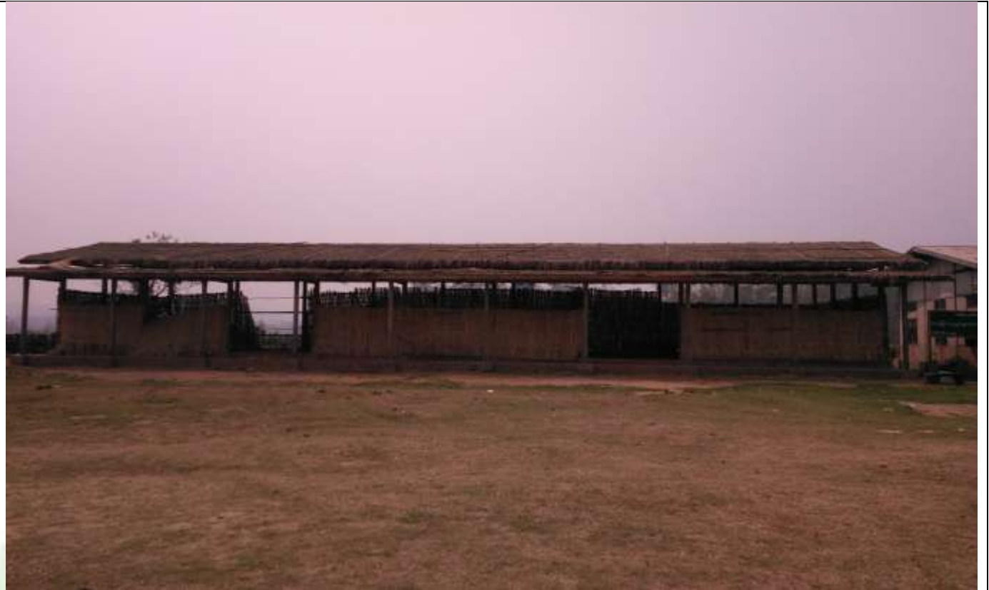
လုပ်ငန်းခွဲ၏မပြုလုပ်မီ မှတ်တမ်းဓာတ်ပုံ