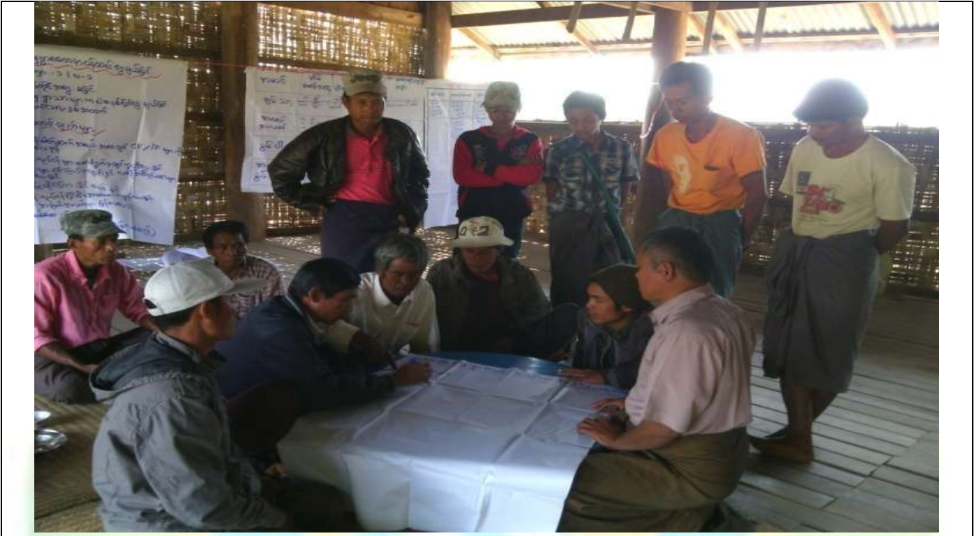
အမျိုးသားအုပ်စု၏ မှတ်တမ်းဓါတ်ပုံ