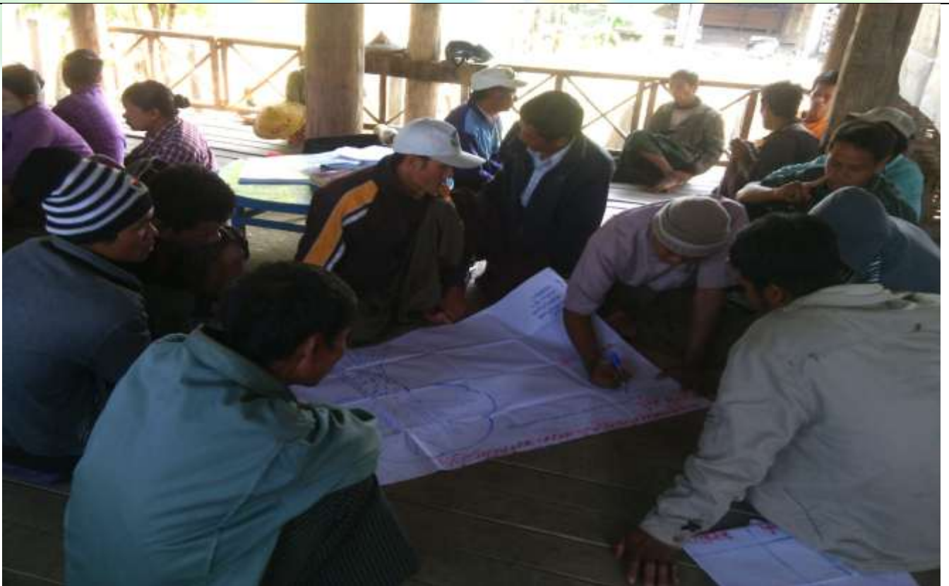
ဖွံ့ဖြိုးရေးအစီအစဉ်ရေးဆွဲခြင်း မှတ်တမ်းခါတ်ပုံ