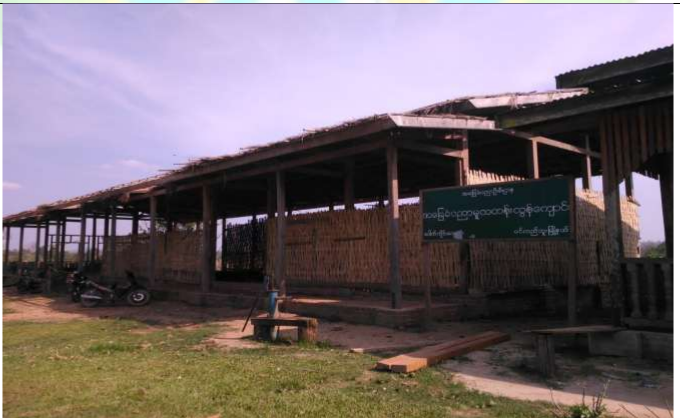
လုပ်ငန်းခွဲ၏မပြုလုပ်မီ မှတ်တမ်းဓာတ်ပုံ