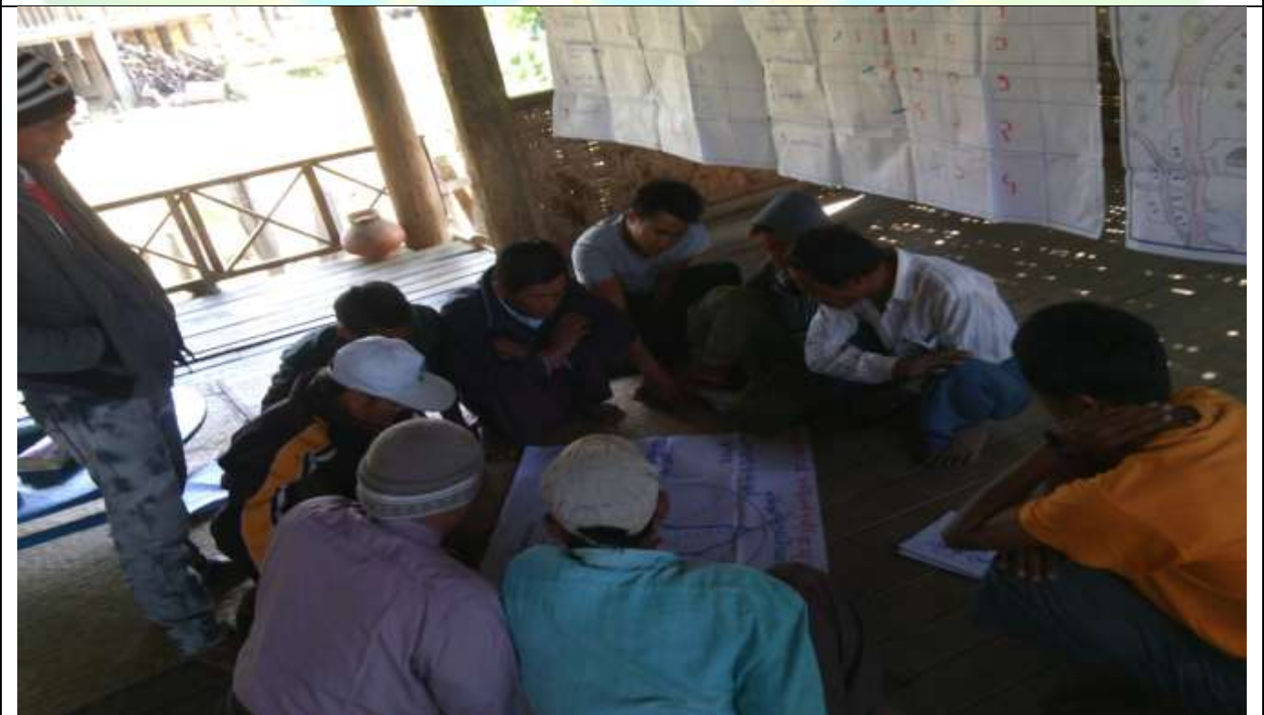
ထိခိုက်လွယ်အုပ်စုများ၏ မှတ်တမ်းခါတ်ပုံ