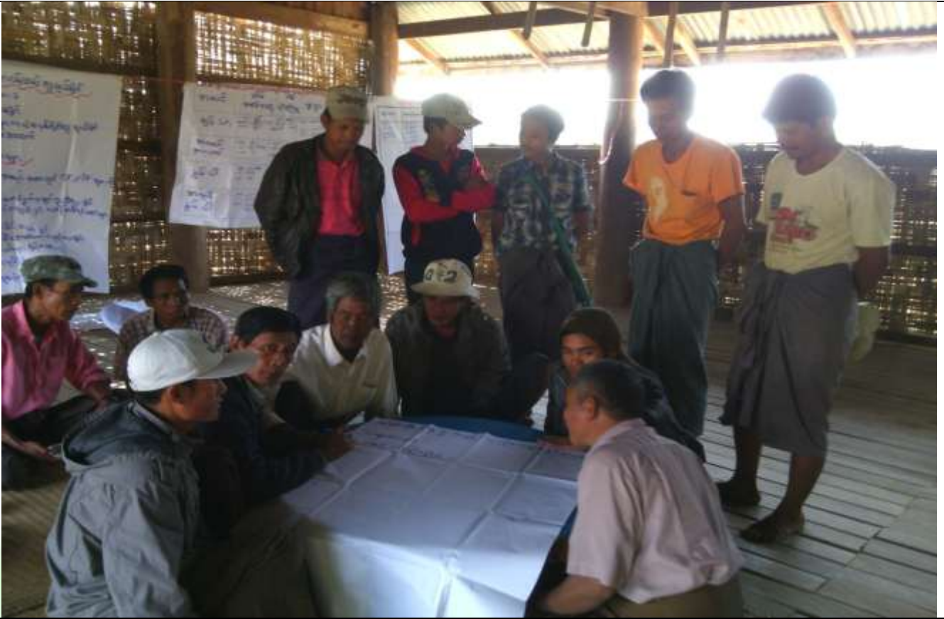
စေတနာ့ဝန်ထမ်းများ ရွေးချယ်ခြင်း မှတ်တမ်းခါတ်ပုံ