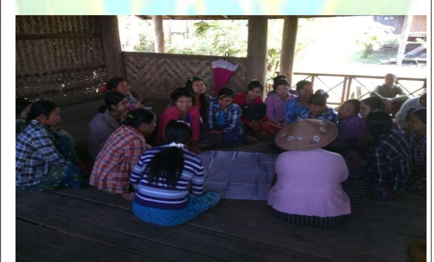
အမျိုးသမီးအုပ်စု၏ မှတ်တမ်းဓါတ်ပုံ