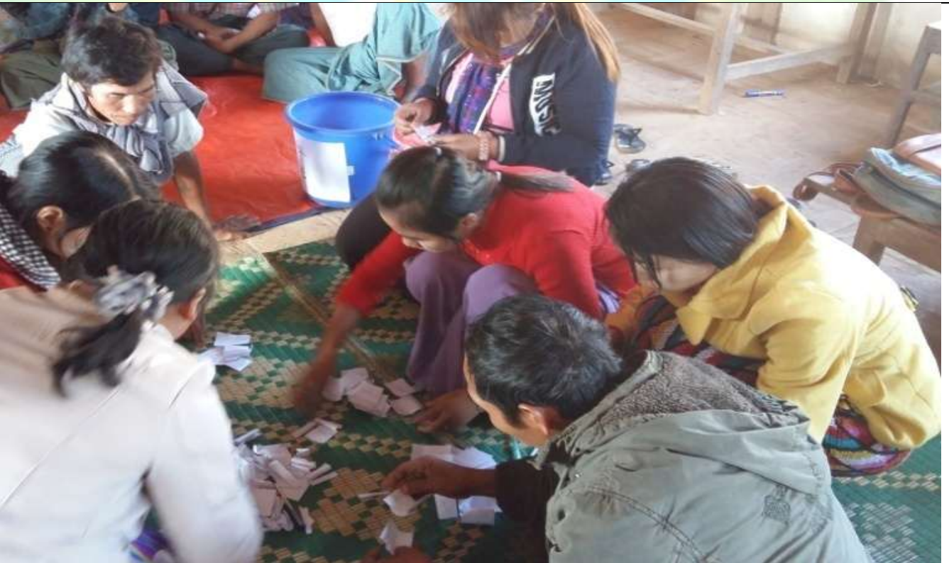
ကော်မတီရွေးချယ်ခြင်း မှတ်တမ်းခါတ်ပုံ