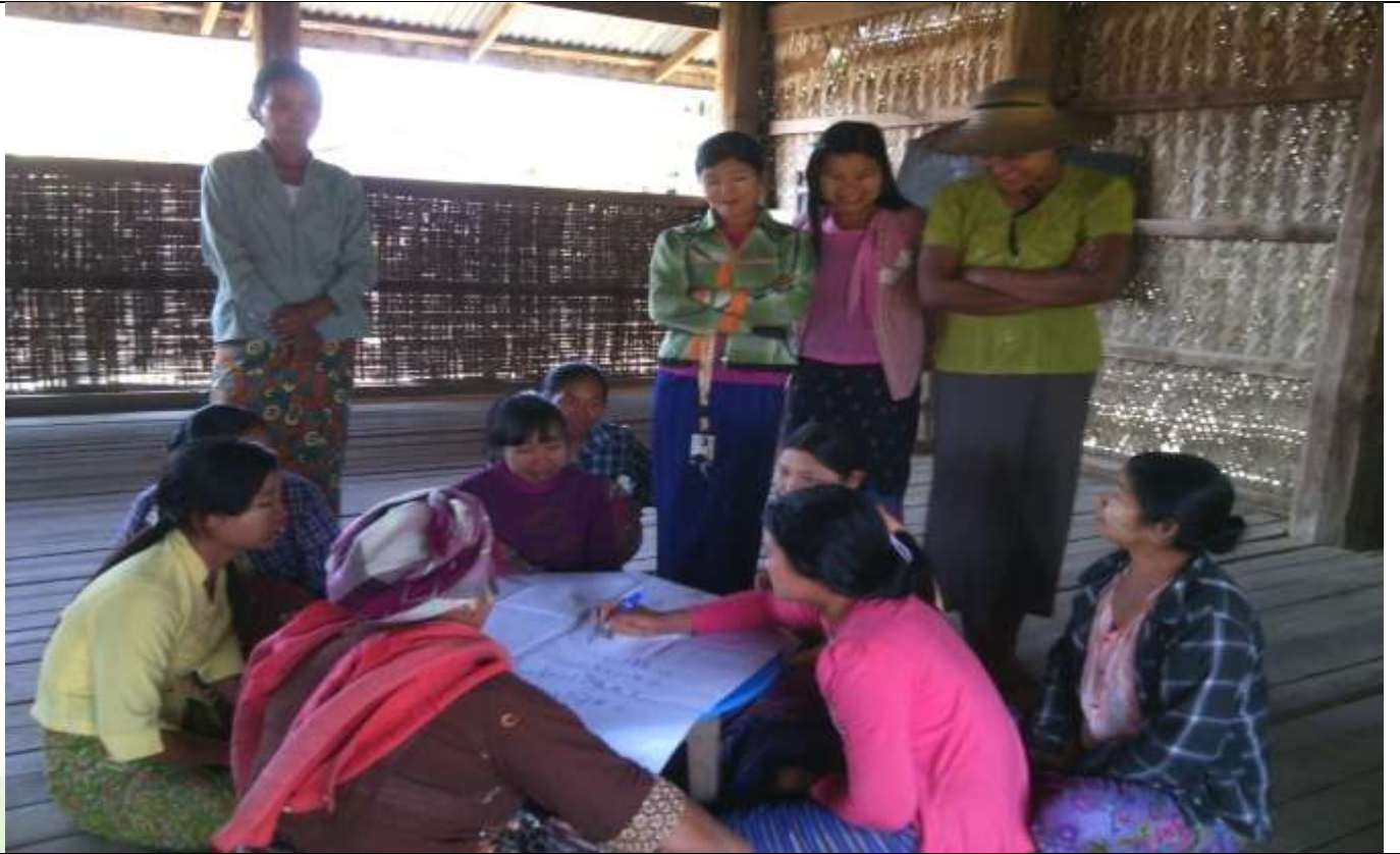
ဖွံ့ဖြိုးရေးအစီအစဉ်ရေးဆွဲခြင်း မှတ်တမ်းခါတ်ပုံ