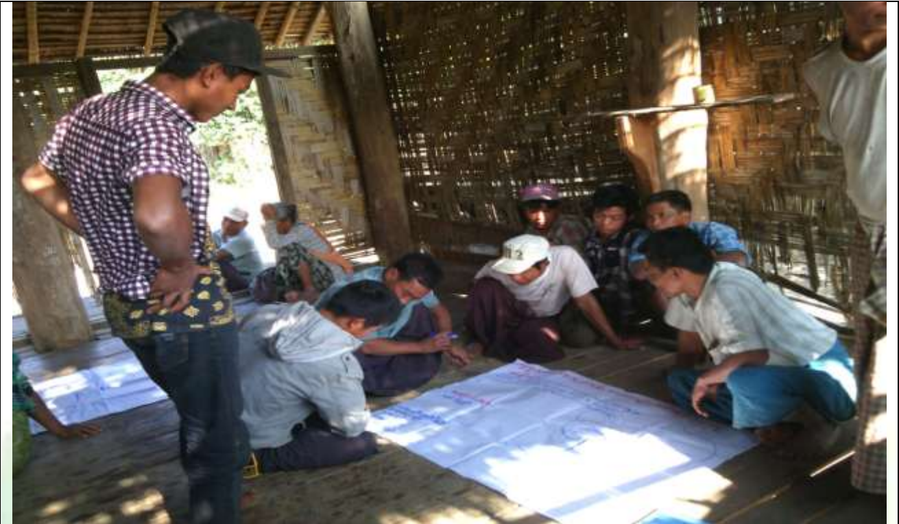
အမျိုးသားအုပ်စု၏ မှတ်တမ်းဓါတ်ပုံ