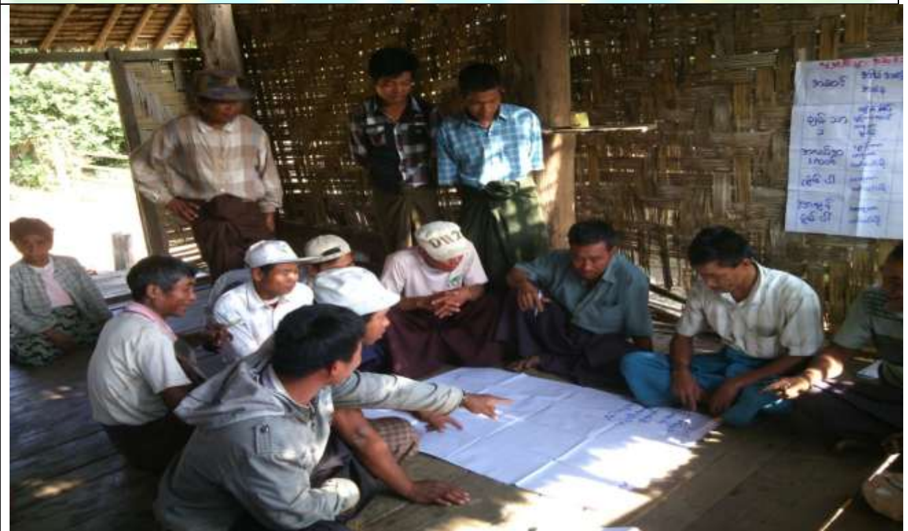
အမျိုးသမီးအုပ်စု၏ မှတ်တမ်းဓါတ်ပုံ