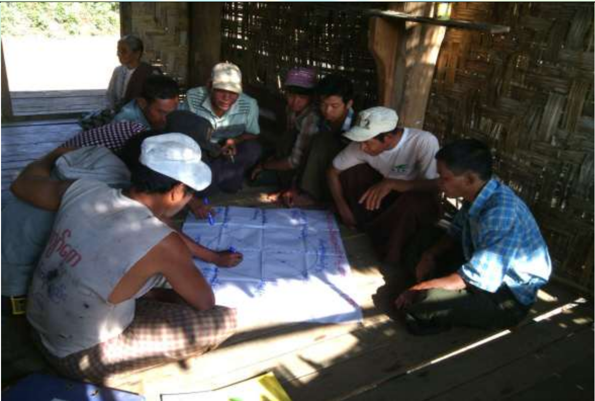
ထိခိုက်လွယ်အုပ်စုများ၏ မှတ်တမ်းခါတ်ပုံ