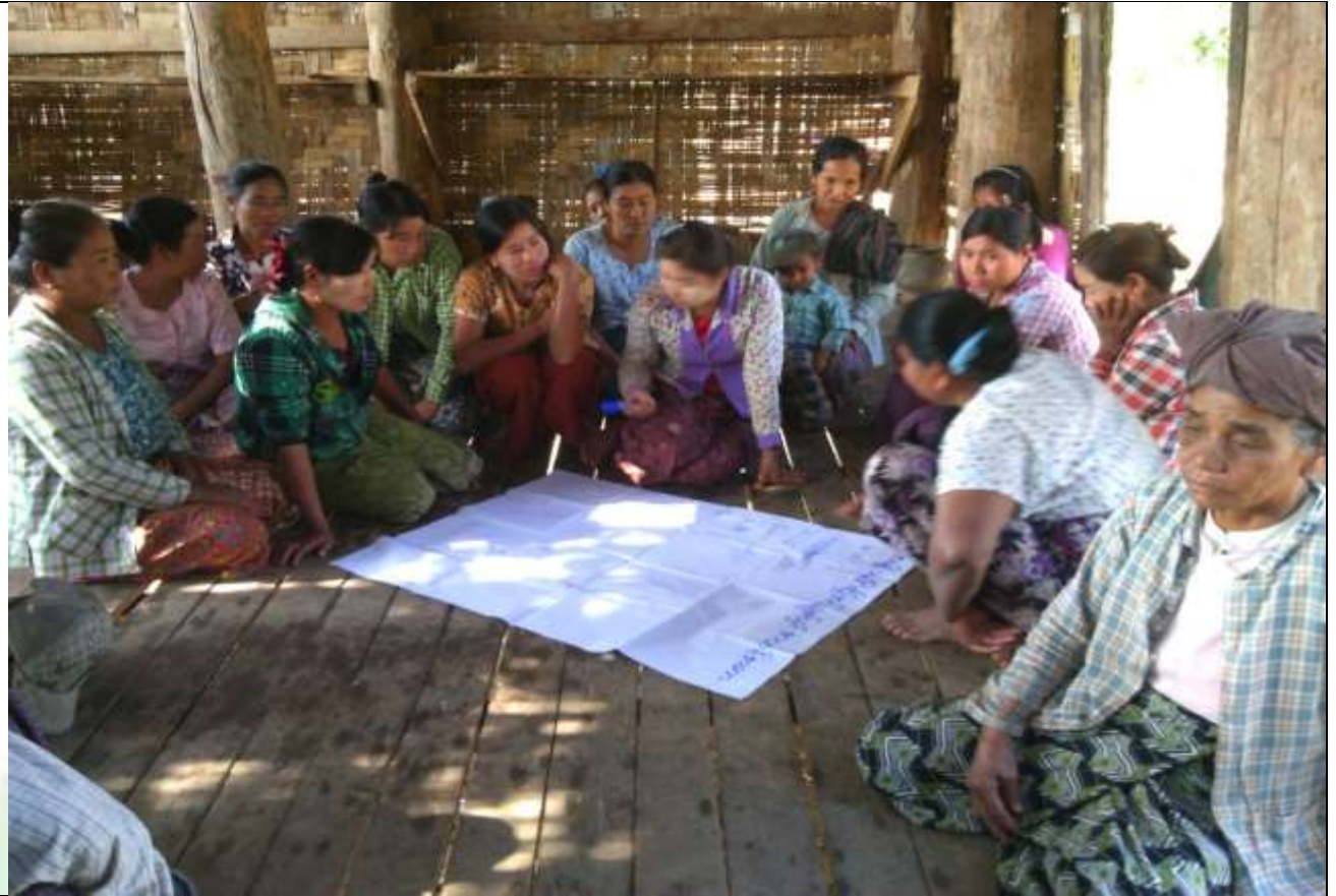
လူငယ်အုပ်စု၏ မှတ်တမ်းခါတ်ပုံ