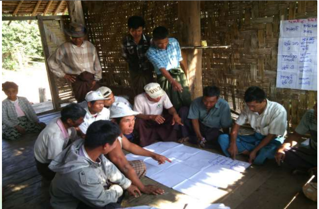
ဖွံ့ဖြိုးရေးအစီအစဉ်ရေးဆွဲခြင်း မှတ်တမ်းဓါတ်ပုံ