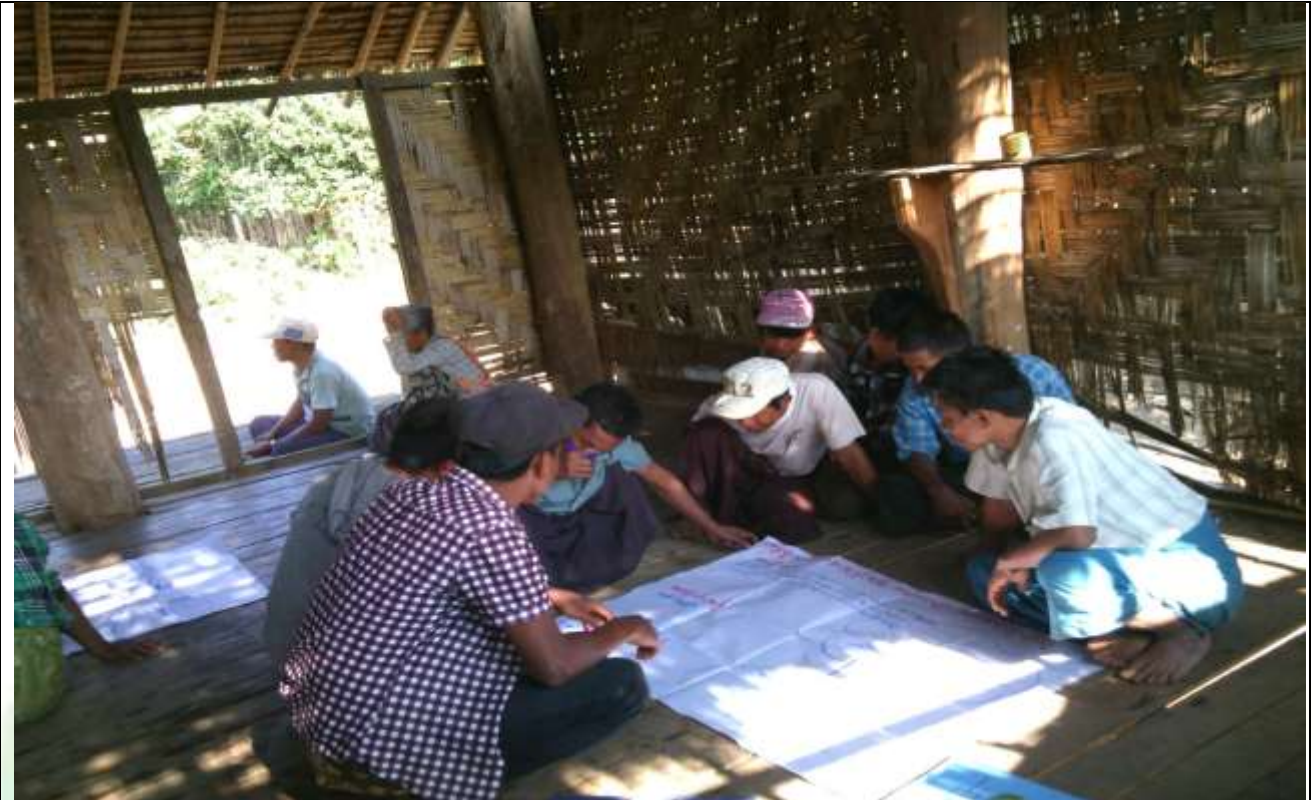
စေတနာ့ဝန်ထမ်းများ ရွေးချယ်ခြင်း မှတ်တမ်းဓါတ်ပုံ