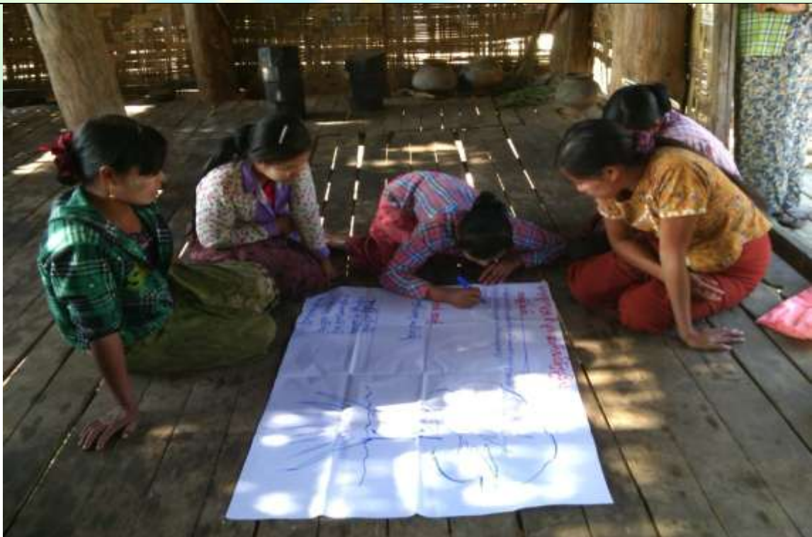
ဖွံ့ဖြိုးရေးအစီအစဉ်ရေးဆွဲခြင်း မှတ်တမ်းဓါတ်ပုံ