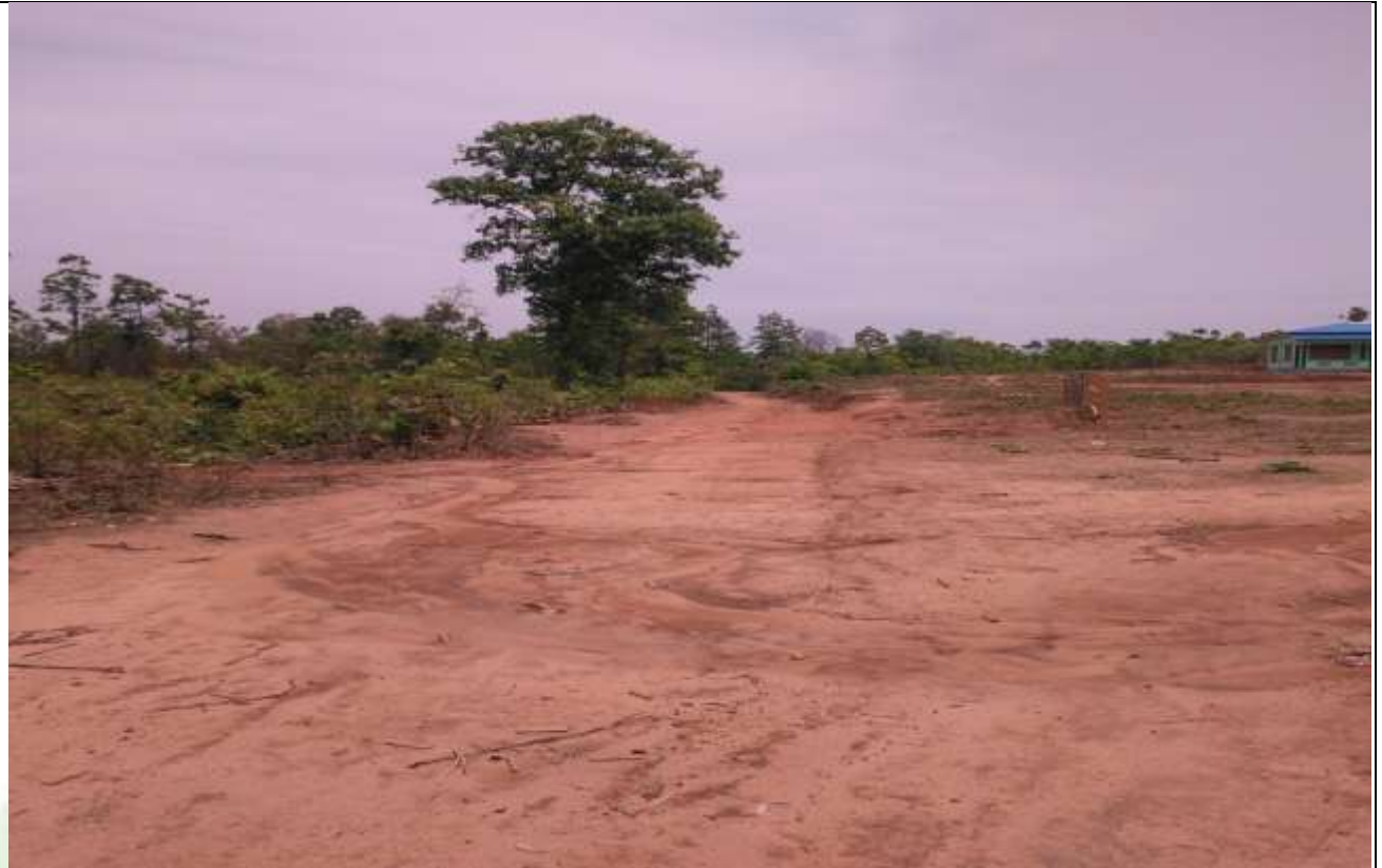
လုပ်ငန်းခွဲ၏မပြုလုပ်မီ မှတ်တမ်းခတ်ပုံ