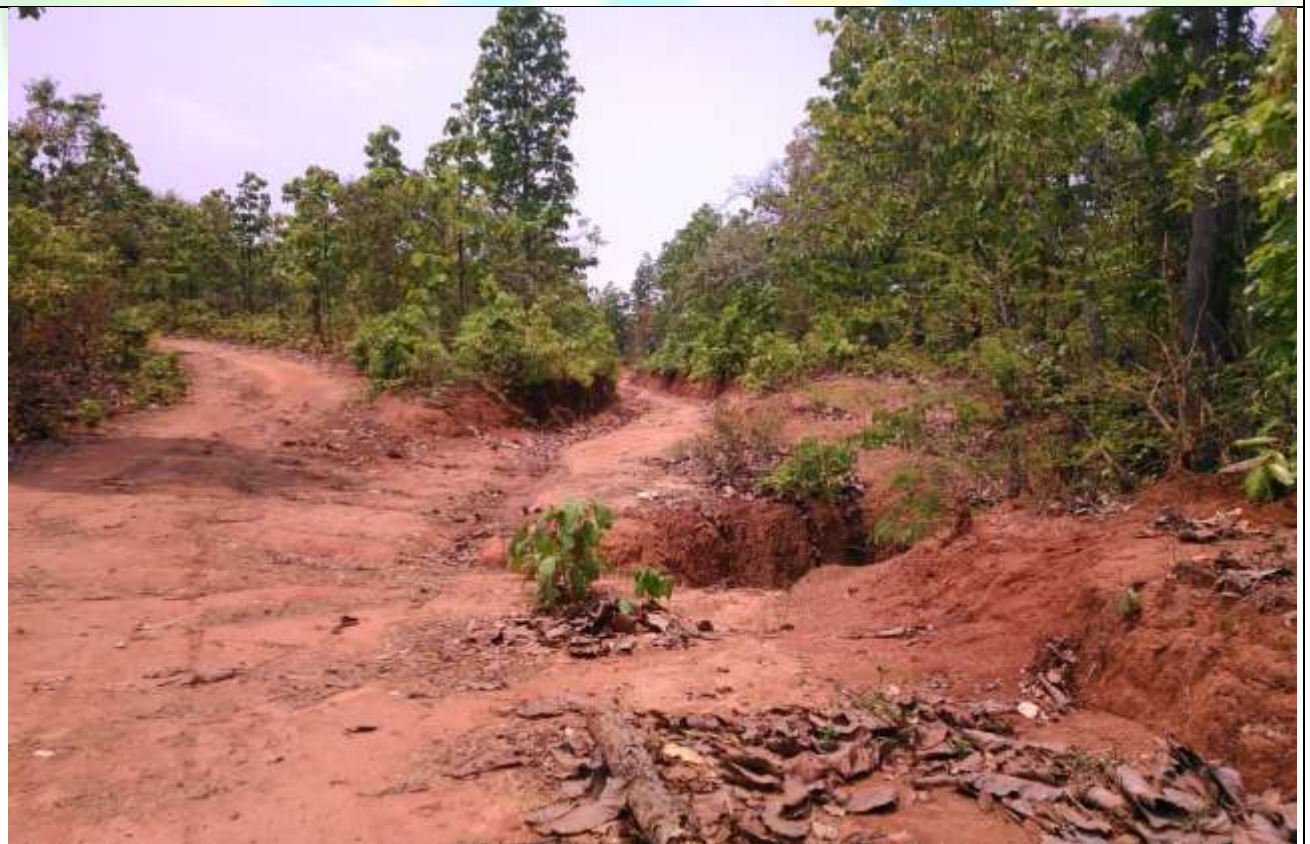
လုပ်ငန်းခွဲ၏မပြုလုပ်မီ မှတ်တမ်းခတ်ပုံ