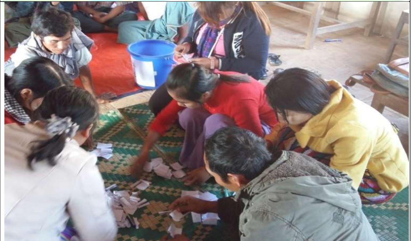
ကော်မတီရွေးချယ်ခြင်း မှတ်တမ်းဓါတ်ပုံ