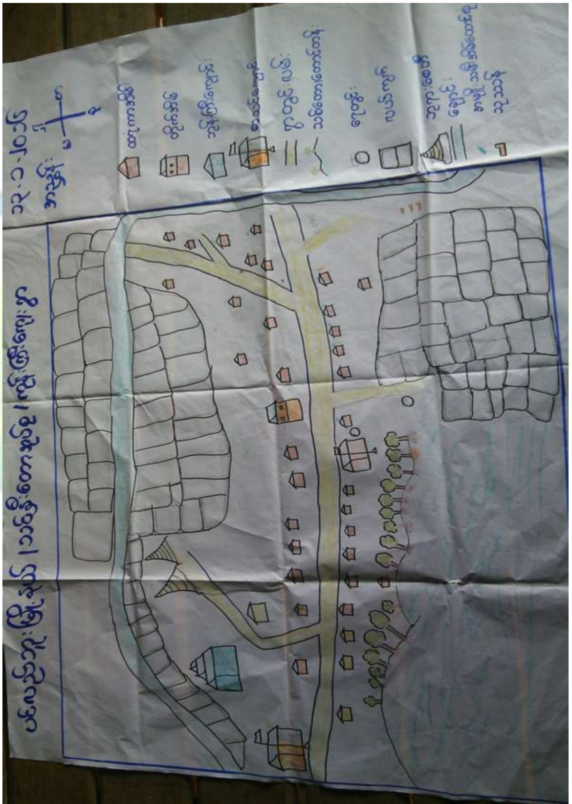
သုံးသပ်ချက်