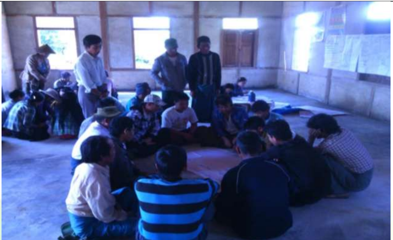
အမျိုးသားအုပ်စု၏ မှတ်တမ်းခါတ်ပုံ