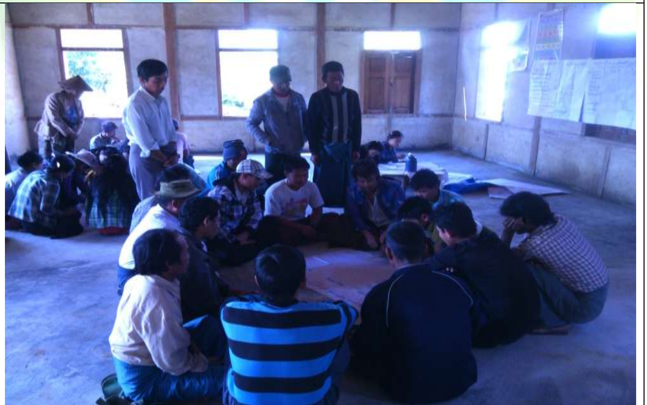
ကော်မတီရွေးချယ်ခြင်း မှတ်တမ်းဓါတ်ပုံ