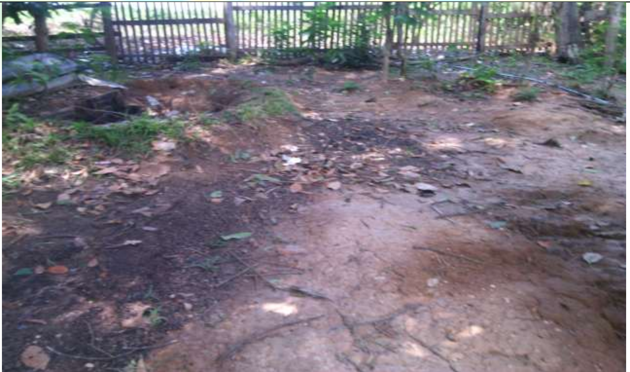
လုပ်ငန်းခွဲ၏မပြုလုပ်မီ မှတ်တမ်းခါတ်ပုံ