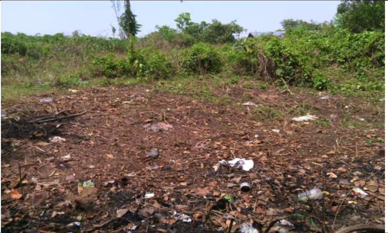
လုပ်ငန်းခွဲ၏မပြုလုပ်မီ မှတ်တမ်းခါတ်ပုံ