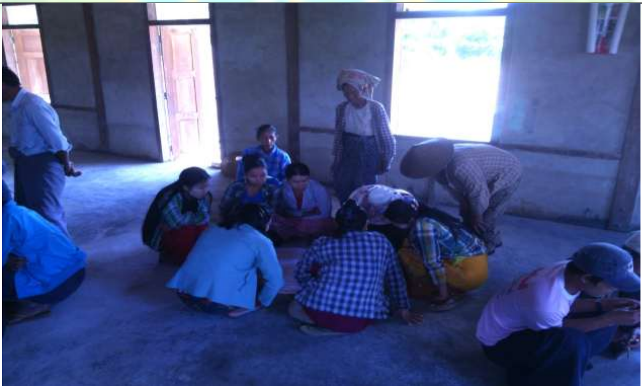
အမျိုးသမီးအုပ်စု၏ မှတ်တမ်းခါတ်ပုံ