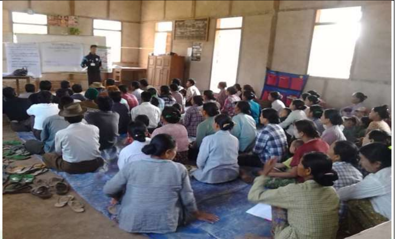
စေတနာ့ဝန်ထမ်းများ ရွေးချယ်ခြင်း မှတ်တမ်းဓါတ်ပုံ