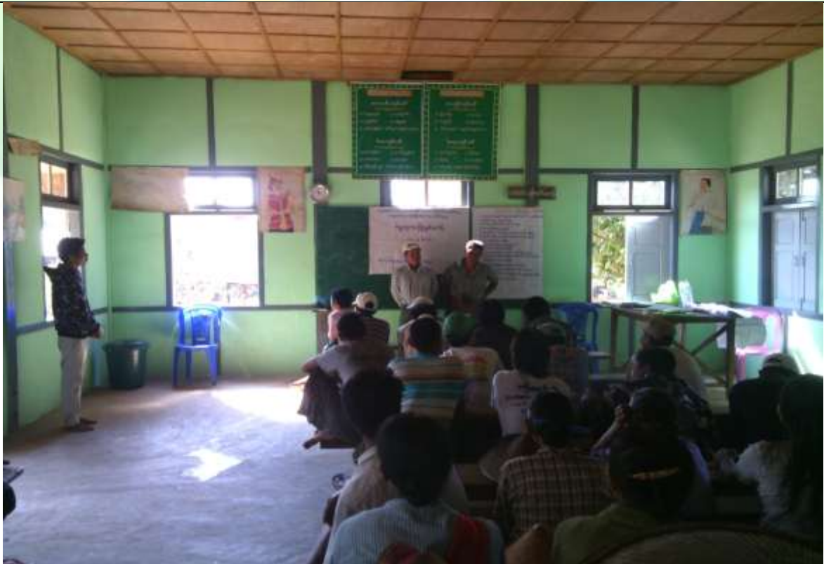
ကော်မတီရွေးချယ်ခြင်း မှတ်တမ်းခါတ်ပုံ