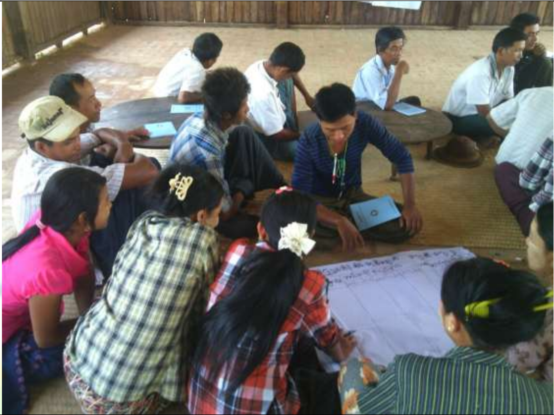
လူငယ်အုပ်စု၏ မှတ်တမ်းခါတ်ပုံ