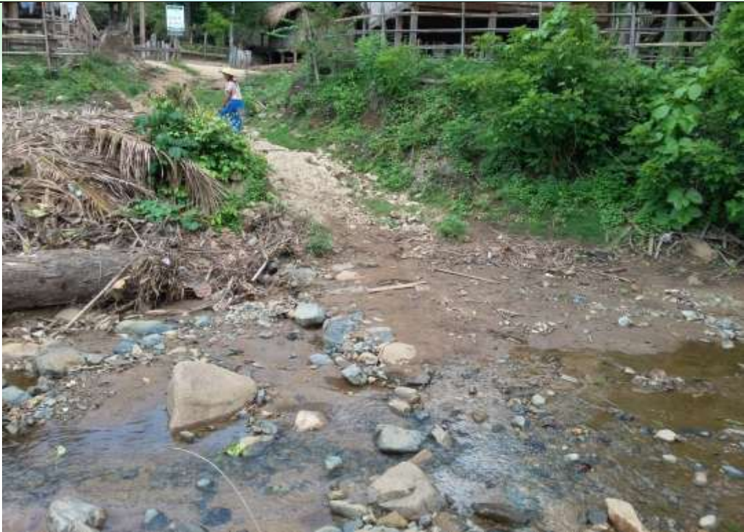
ပထမနှစ်လုပ်ငန်းခွဲ၏မပြုလုပ်မီ မှတ်တမ်းဓာတ်ပုံ