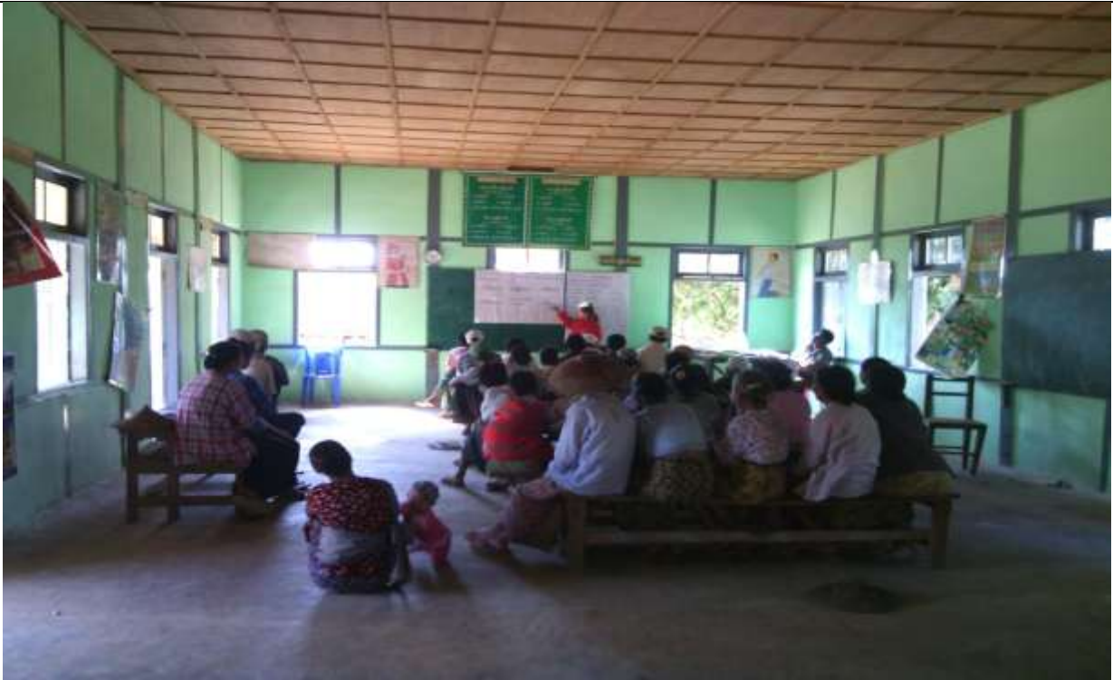
စေတနာ့ဝန်ထမ်းများ ရွေးချယ်ခြင်း မှတ်တမ်းခါတ်ပုံ