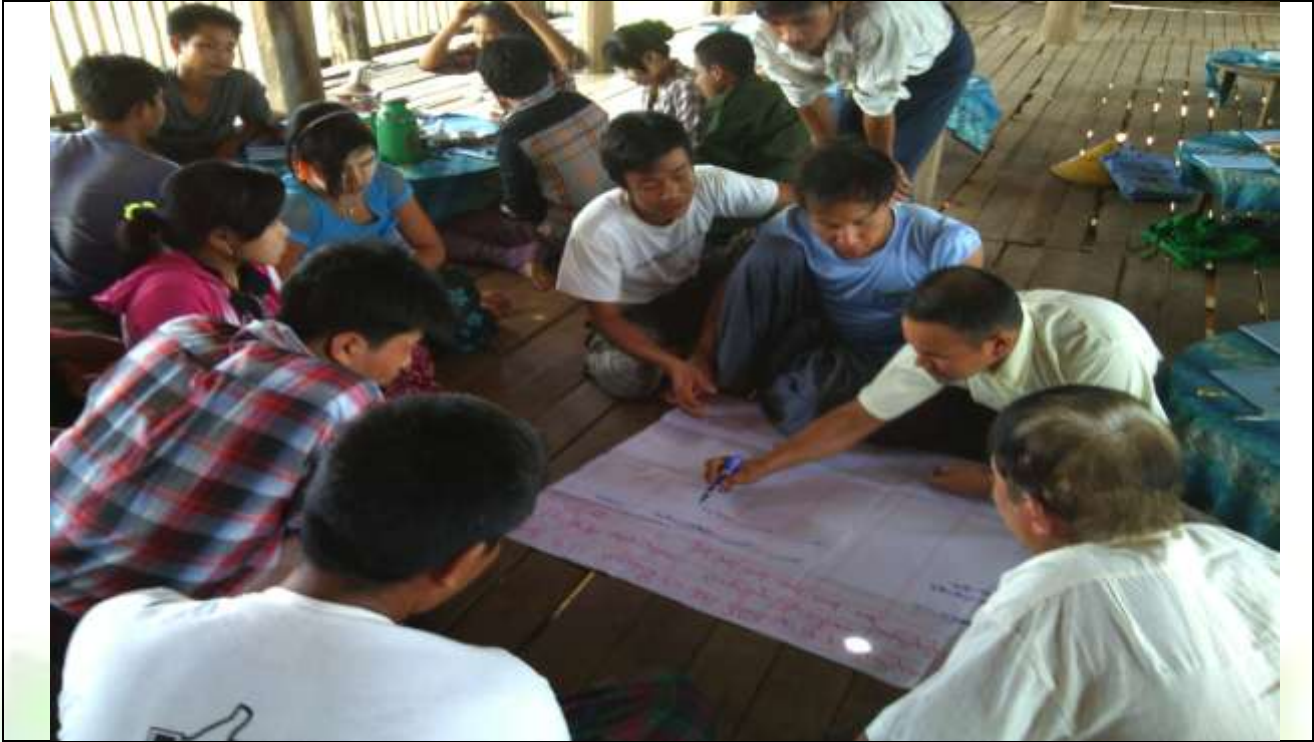
အမျိုးသားအုပ်စု၏ မှတ်တမ်းခါတ်ပုံ