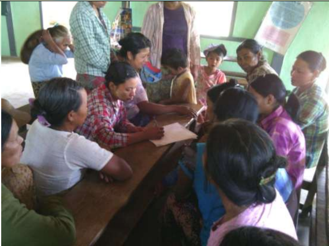
ထိခိုက်လွယ်အုပ်စုများ၏ မှတ်တမ်းခါတ်ပုံ