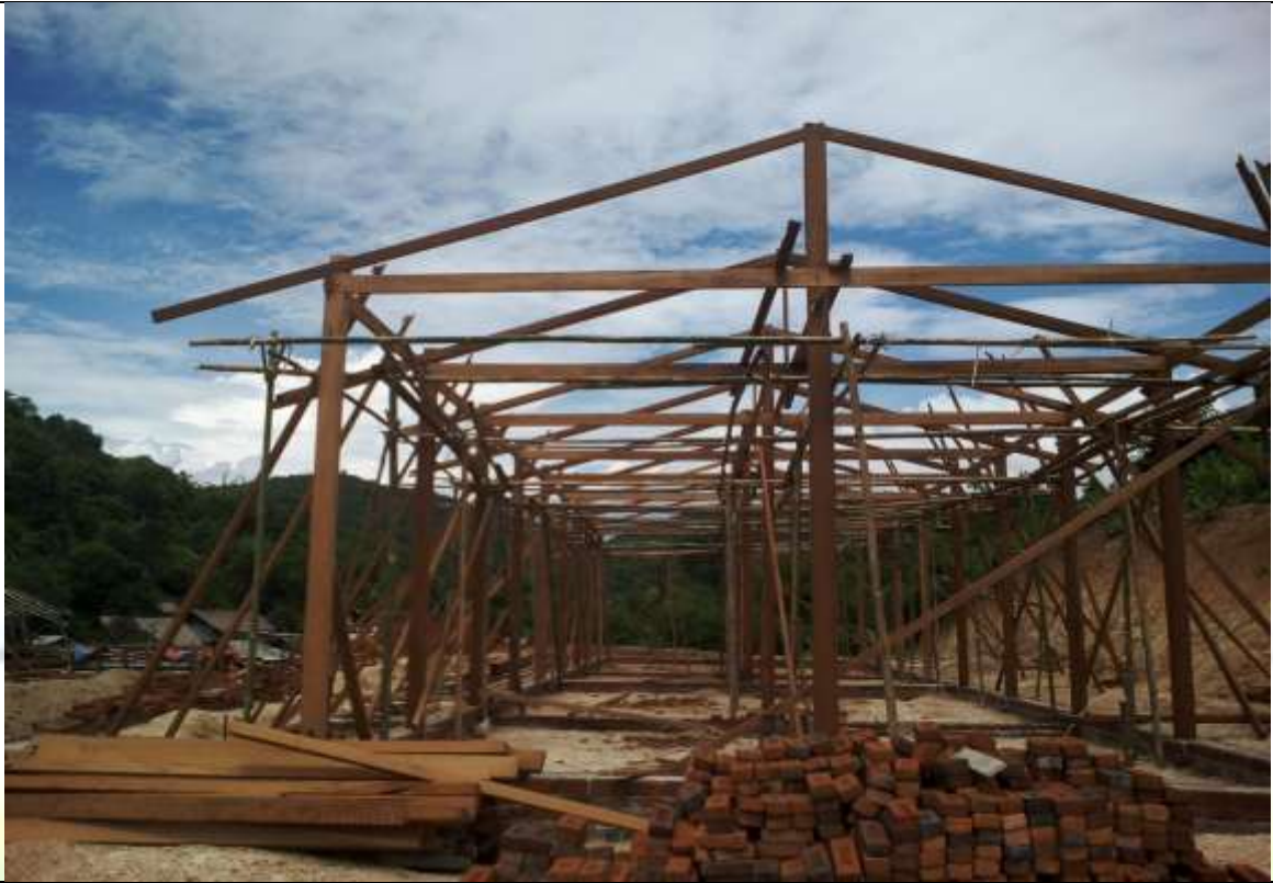
လုပ်ငန်းခွဲပြုလုပ်နေစဉ် မှတ်တမ်းဓာတ်ပုံ