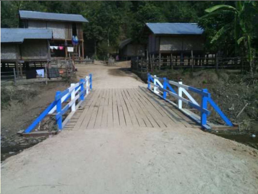
ပထမနှစ်လုပ်ငန်းခွဲပြီးစီးမှု မှတ်တမ်းဓာတ်ပုံ