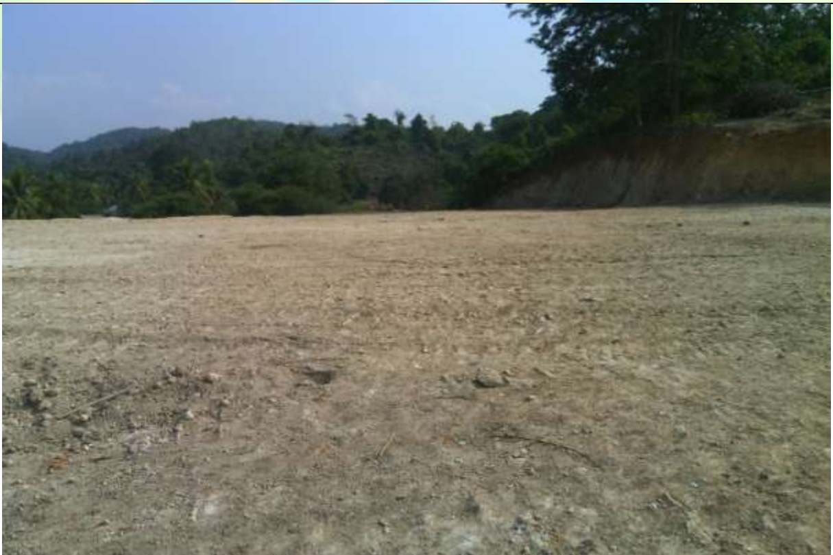
ဒုတိယနှစ် လုပ်ငန်းမပြုလုပ်မီ မှတ်တမ်းဓာတ်ပုံ