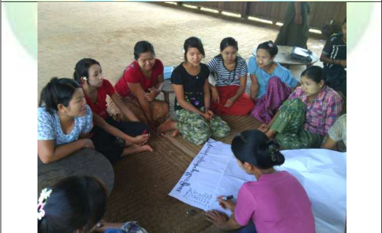
အမျိုးသမီးအုပ်စု၏ မှတ်တမ်းခါတ်ပုံ