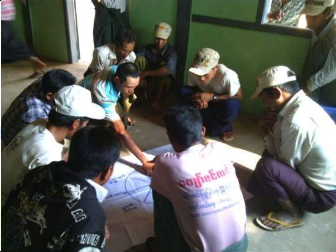
ဖွံ့ဖြိုးရေးအစီအစဉ်ရေးဆွဲခြင်း မှတ်တမ်းဓာတ်ပုံ