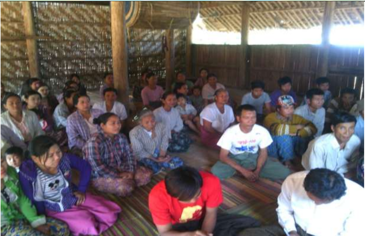
ဖွံ့ဖြိုးရေးအစီအစဉ်ရေးဆွဲခြင်း မှတ်တမ်းဓာတ်ပုံ