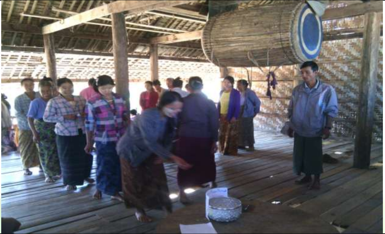
စေတနာ့ဝန်ထမ်းများ ရွေးချယ်ခြင်း မှတ်တမ်းဓါတ်ပုံ