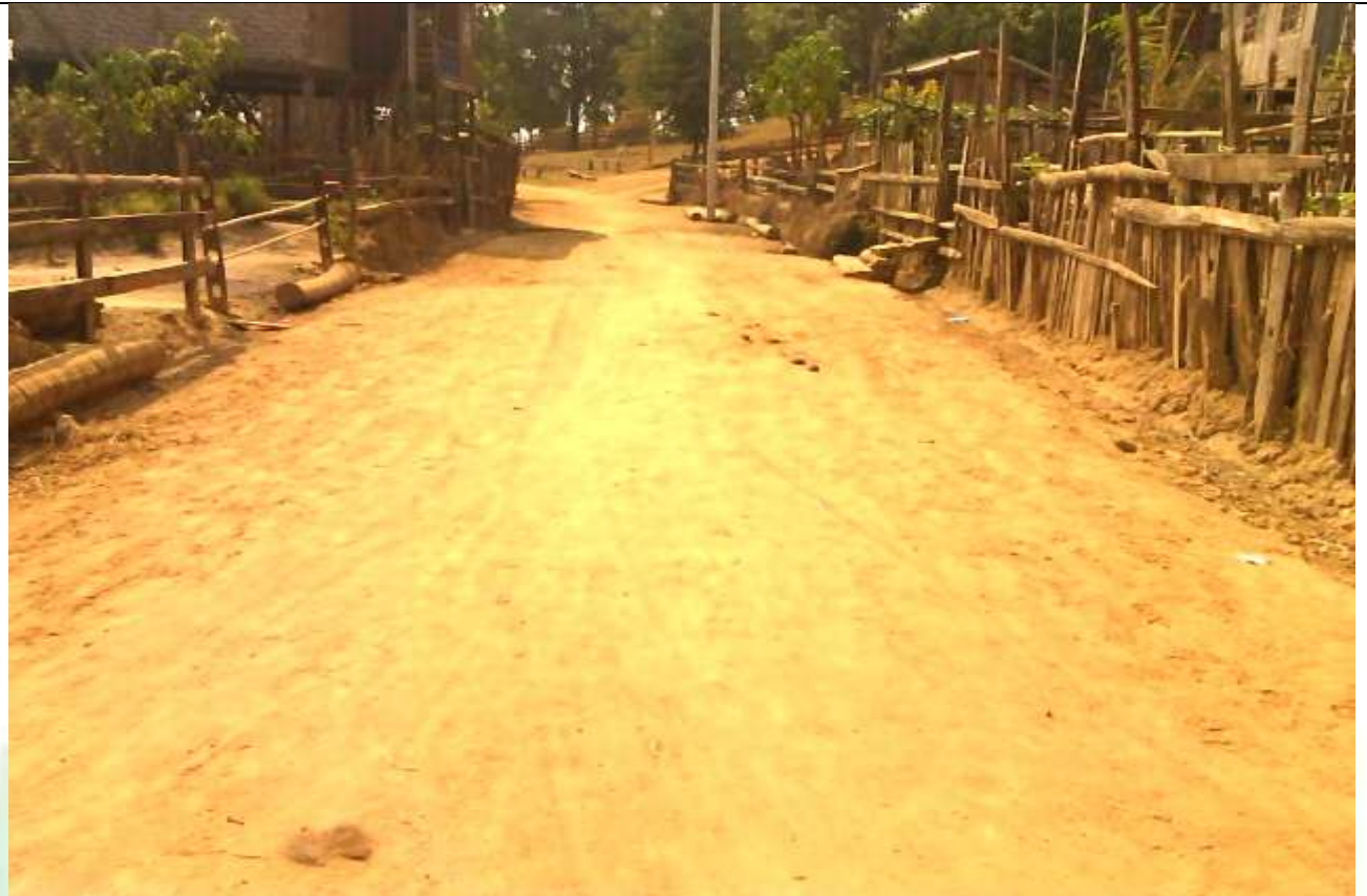
လုပ်ငန်းခွဲ၏မပြုလုပ်မီ မှတ်တမ်းဓာတ်ပုံ