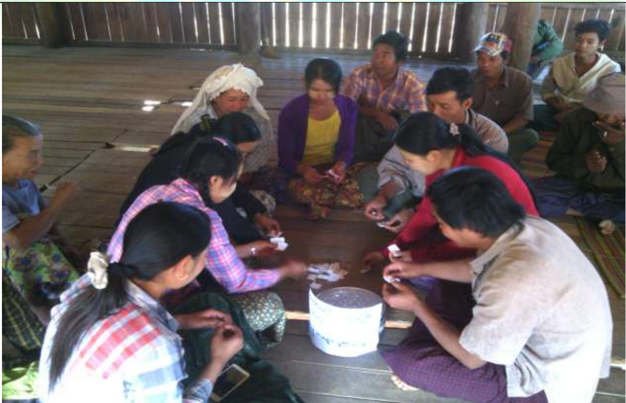
ကော်မတီရွေးချယ်ခြင်း မှတ်တမ်းဓါတ်ပုံ