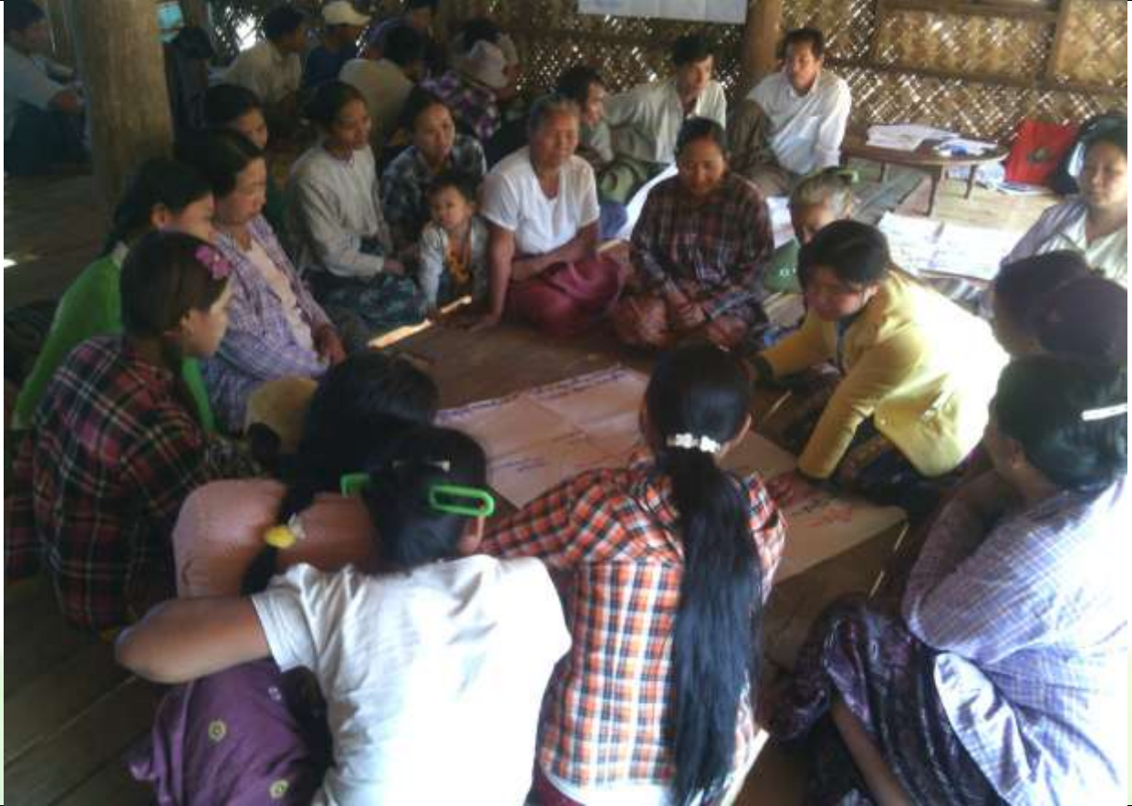
ဖွံ့ဖြိုးရေးအစီအစဉ်ရေးဆွဲခြင်း မှတ်တမ်းဓာတ်ပုံ