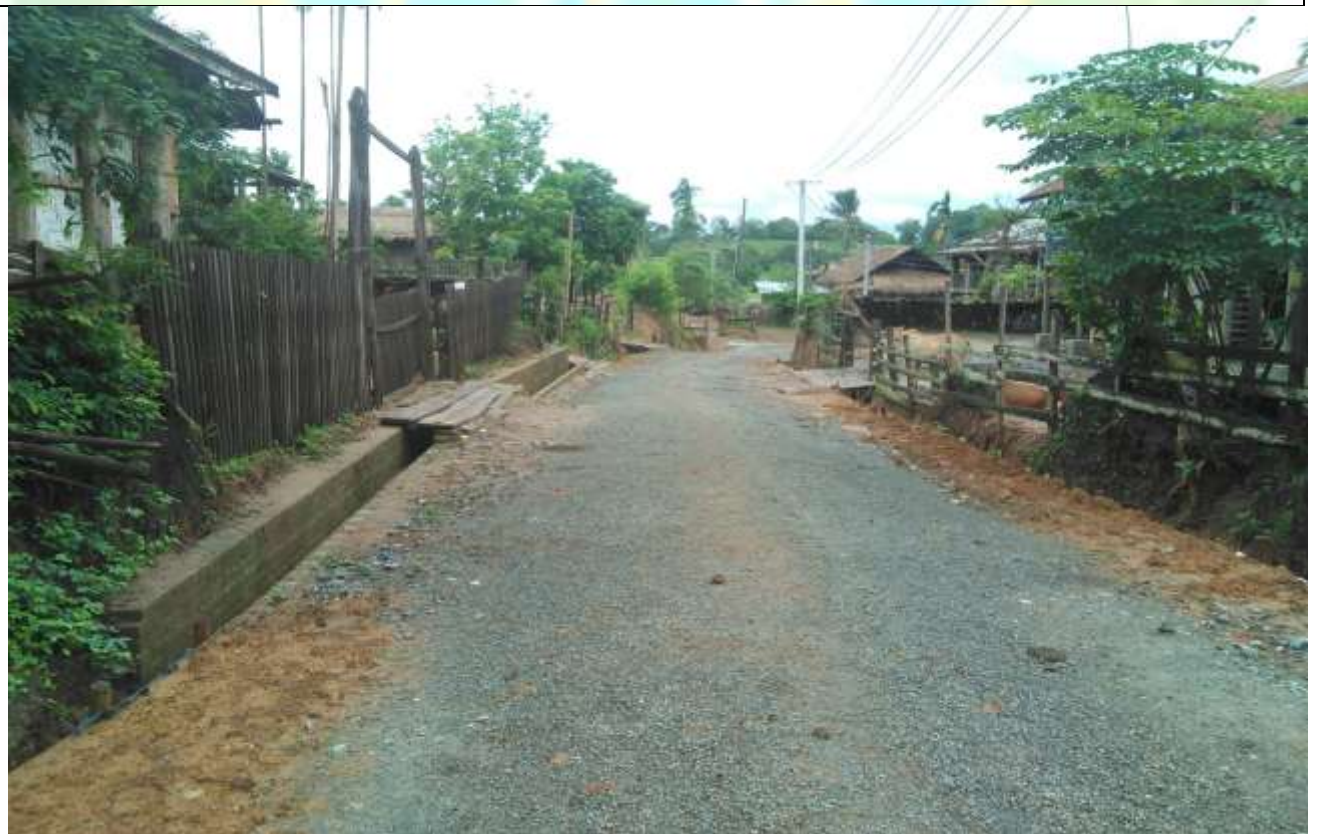
လုပ်ငန်းခွဲလုပ်ဆောင်ပြီး မှတ်တမ်းဓာတ်ပုံ