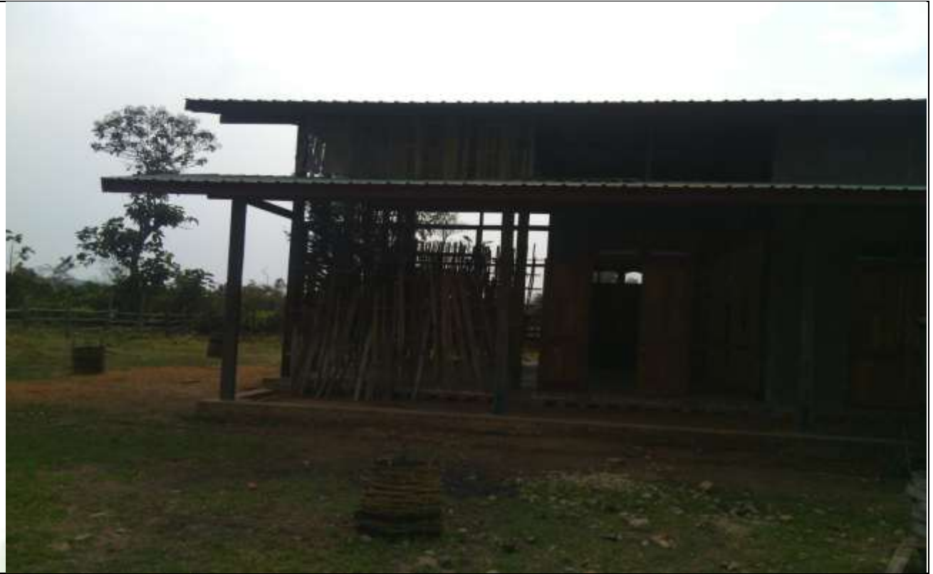
လုပ်ငန်းခွဲ၏မပြုလုပ်မီ မှတ်တမ်းခတ်ပုံ