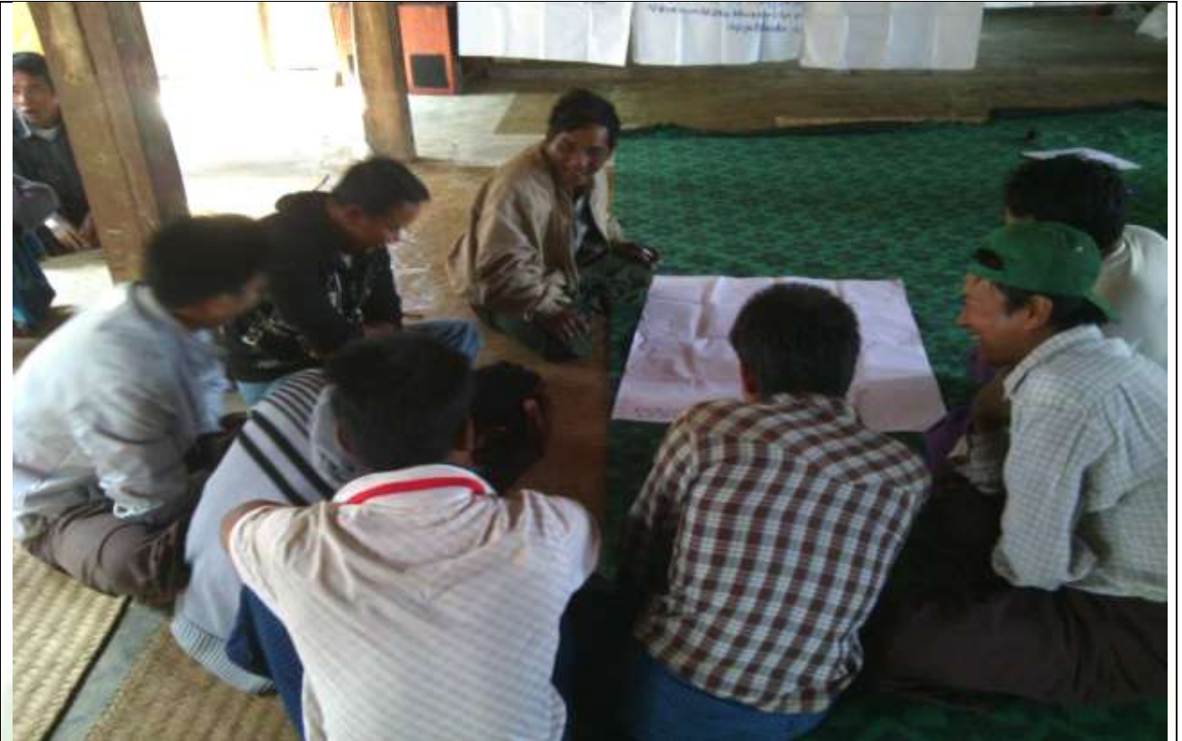
လူငယ်အုပ်စု၏ မှတ်တမ်းခါတ်ပုံ