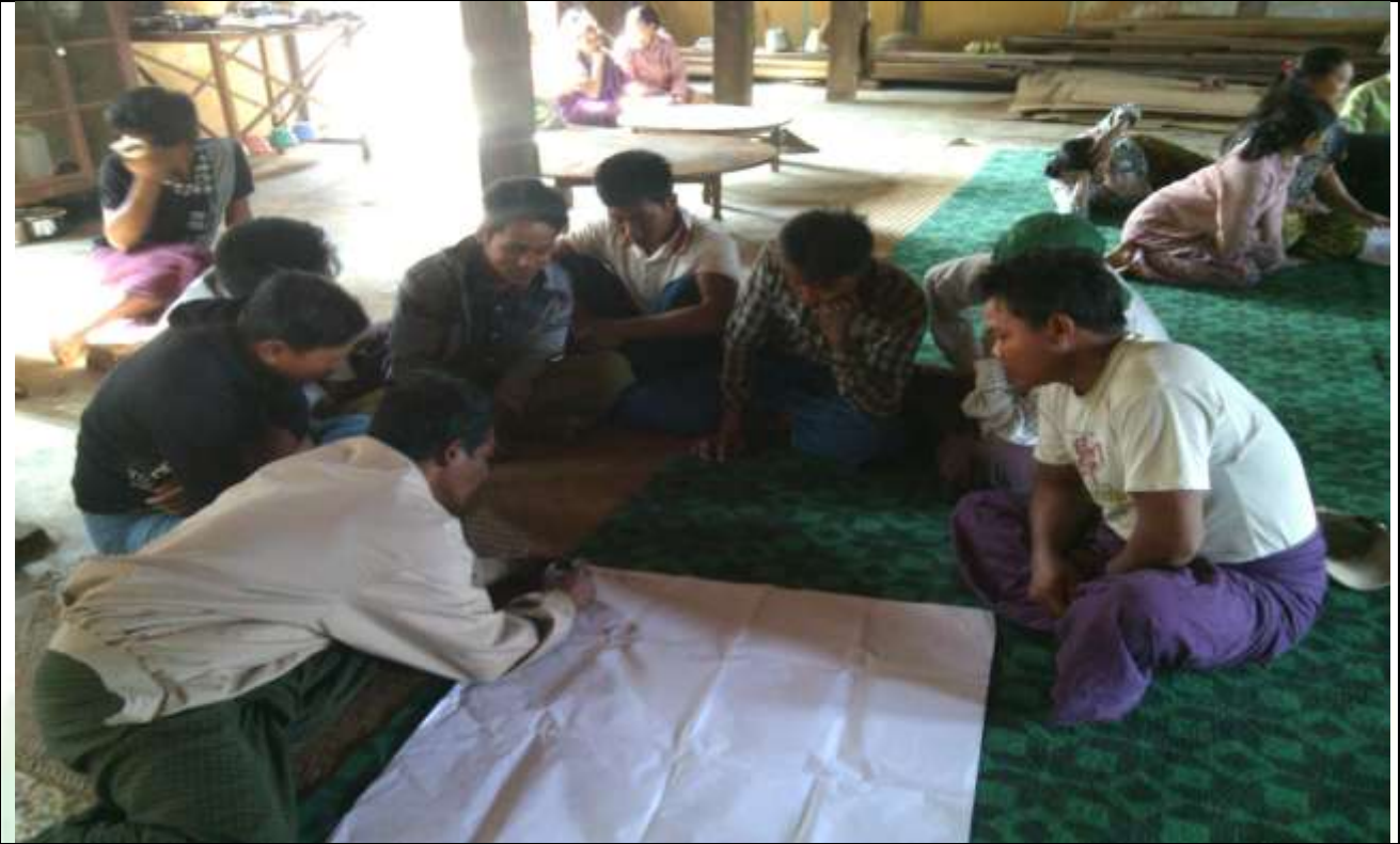
အမျိုးသားအုပ်စု၏ မှတ်တမ်းခါတ်ပုံ