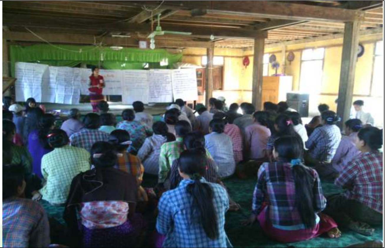
စေတနာ့ဝန်ထမ်းများ ရွေးချယ်ခြင်း မှတ်တမ်းဓါတ်ပုံ