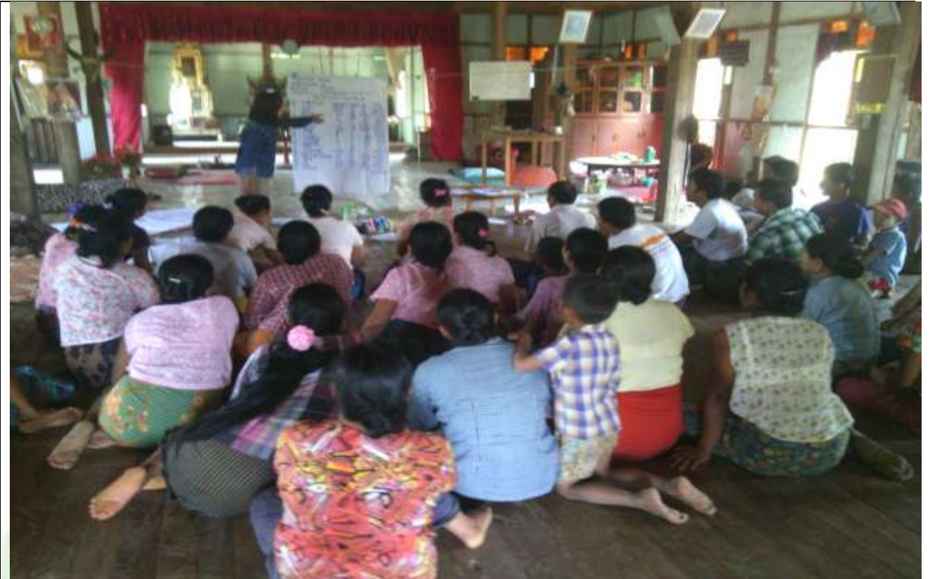
ဖွံ့ဖြိုးရေးအစီအစဉ်ရေးဆွဲခြင်း မှတ်တမ်းဓါတ်ပုံ