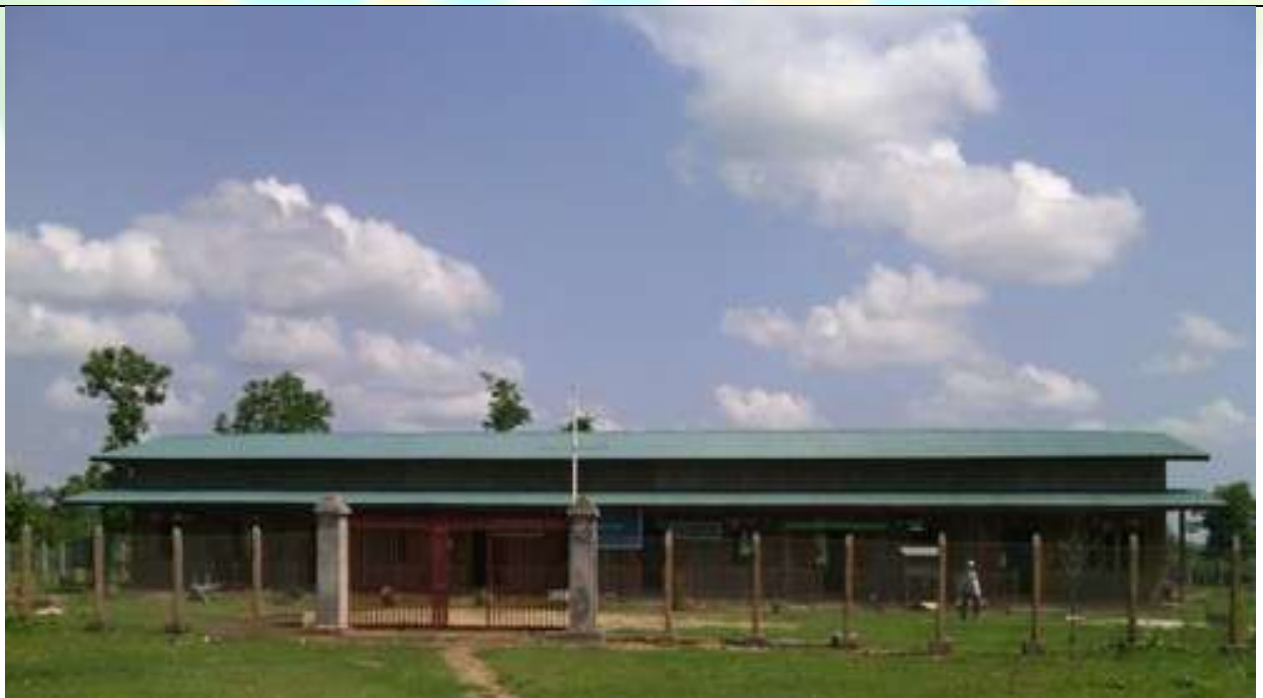
ဒုတိယနှစ် စီမံကိန်းလုပ်ငန်းခွဲပြုလုပ်ပြီးစီးသည့် မှတ်တမ်းခတ်ပုံ