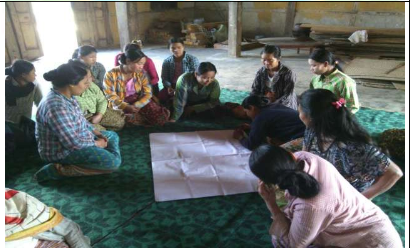
အမျိုးသမီးအုပ်စု၏ မှတ်တမ်းခါတ်ပုံ