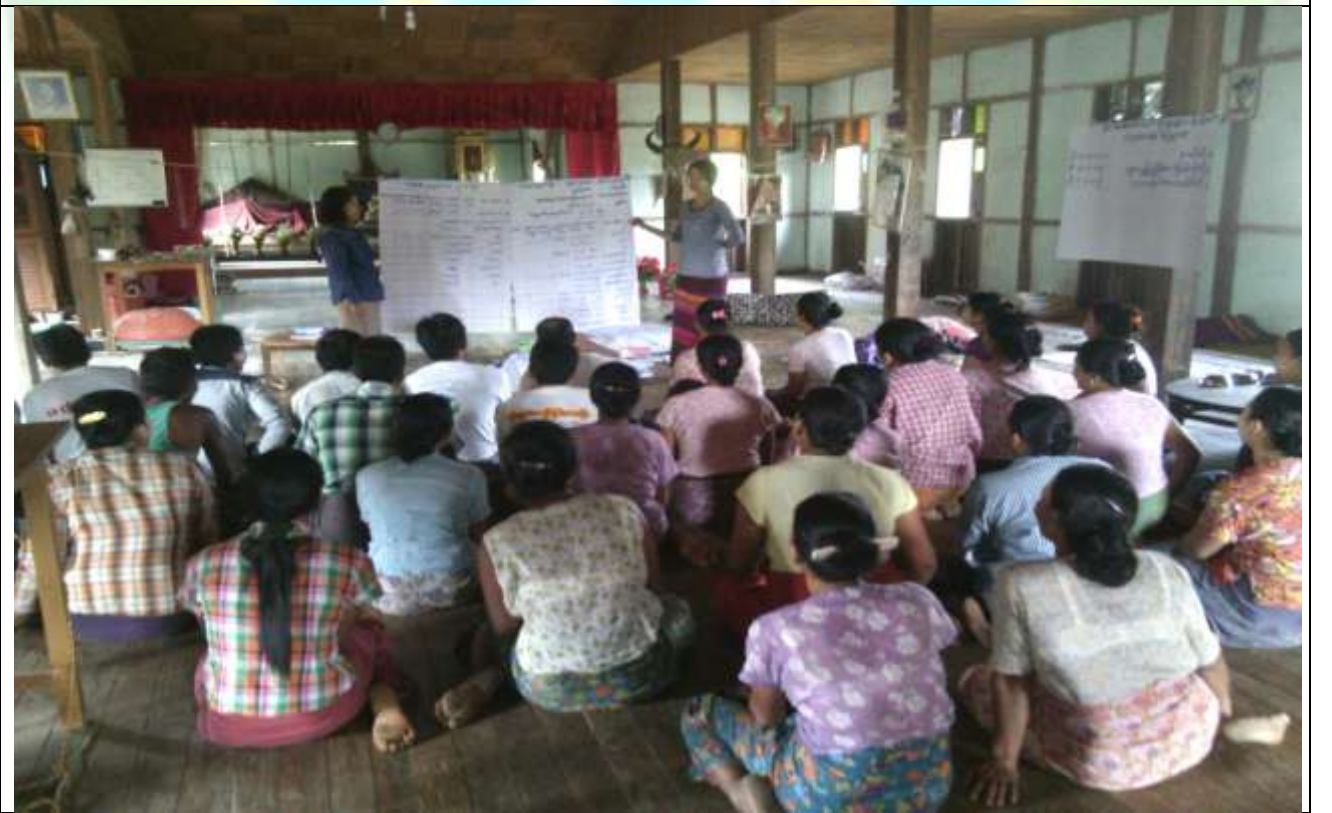
ဖွံ့ဖြိုးရေးအစီအစဉ်ရေးဆွဲခြင်း မှတ်တမ်းဓါတ်ပုံ