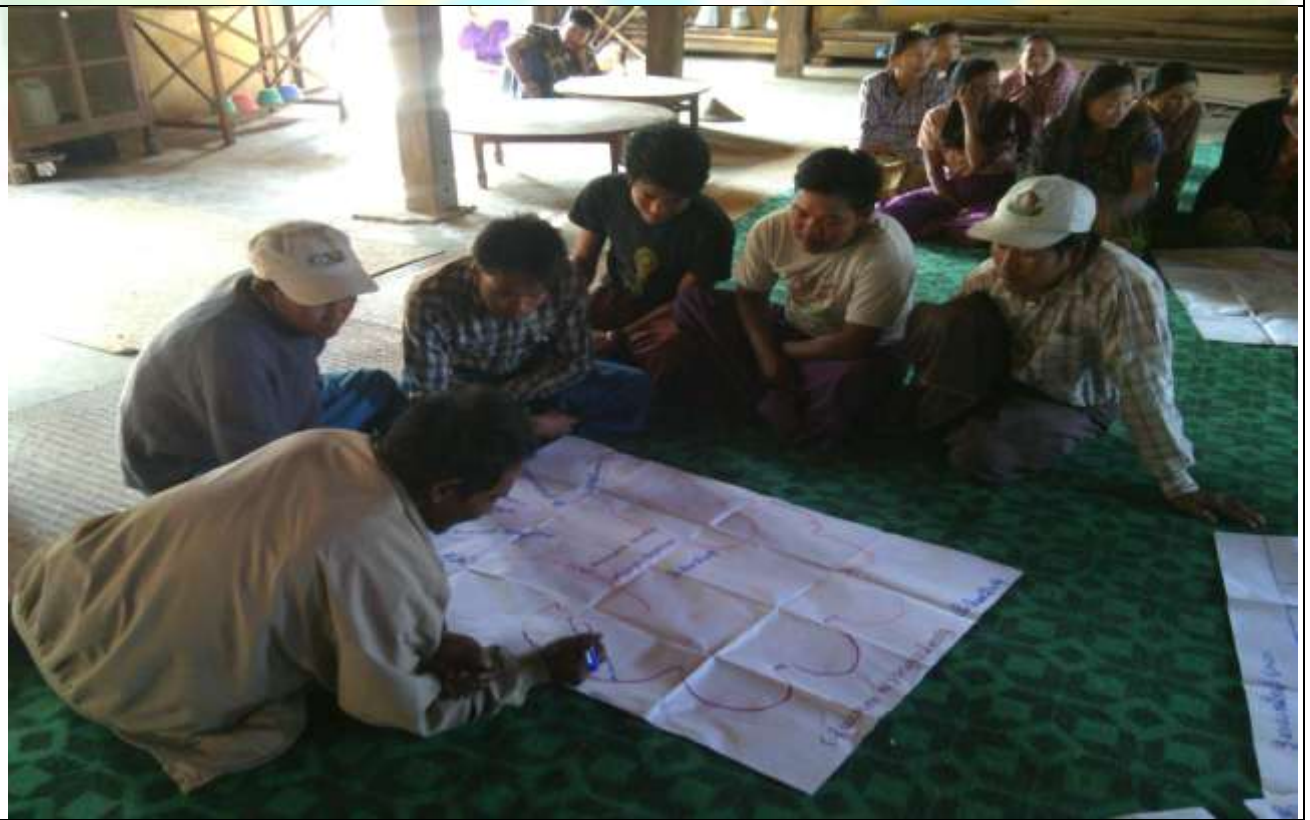
ထိခိုက်လွယ်အုပ်စုများ၏ မှတ်တမ်းခါတ်ပုံ