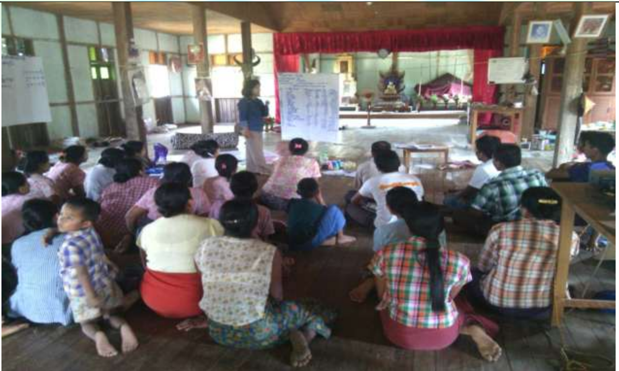
ကော်မတီရွေးချယ်ခြင်း မှတ်တမ်းဓါတ်ပုံ