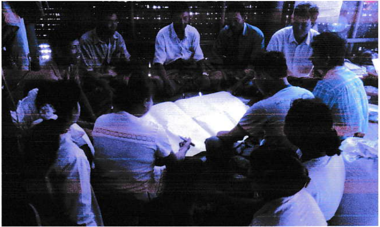
အမျိုးသား/သမီးအတူတကွပူးပေါင်းပါဝင်နေပုံ