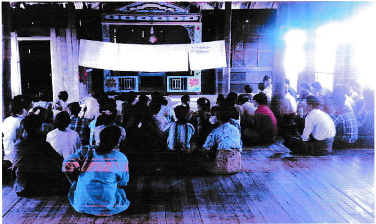
ကျေးရွာလူထု၏ပူးပေါင်းပါဝင်နေပုံ