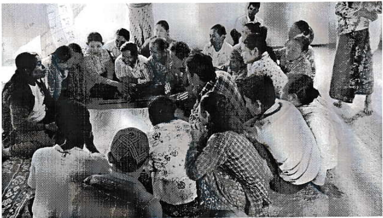
လက်သမားကရင်အုပ်စု၊အမှတ်(၃) ရပ်ကွက် VDP ရေးဆွဲနေပုံ