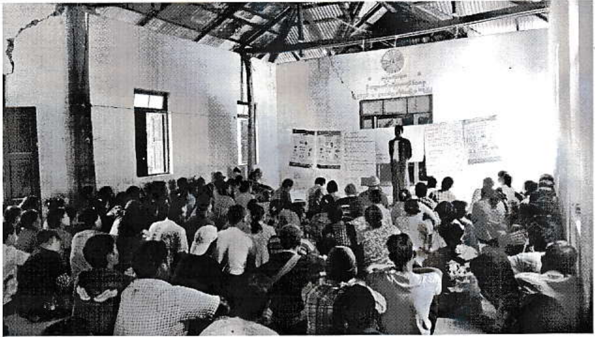
လက်သမားကရင်အုပ်စု၊အမှတ်(၃)ရပ်ကွက် အစည်းအဝေးကျင်းပနေပုံ