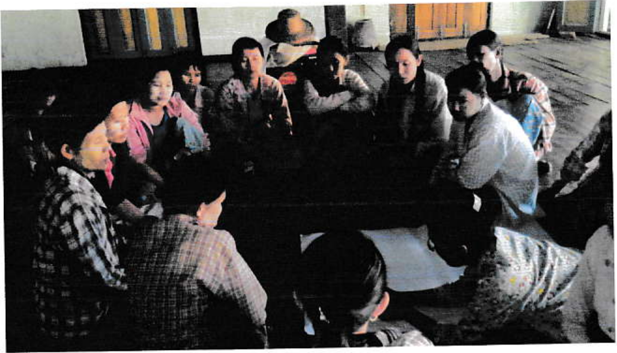
ရွာ၏ ဗြဟ္မနာ အခက်အခဲ များ အား ခုပေါင်း၊ ဆွေးနွေးနေ့ ဇွဲပုံ ( အမျိုးသမီးများ )