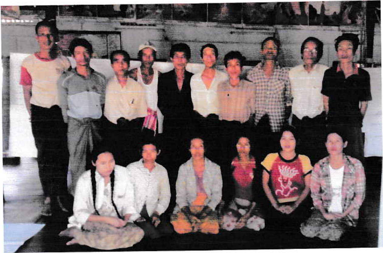
ဝိမ္ဗူလီ၊ အထောက်အကူပြုကြောင်းမိတ် ဖွဲ့စည်း ဖြီး မြတ်တမ်းတင်ဇာတ်ပုံ