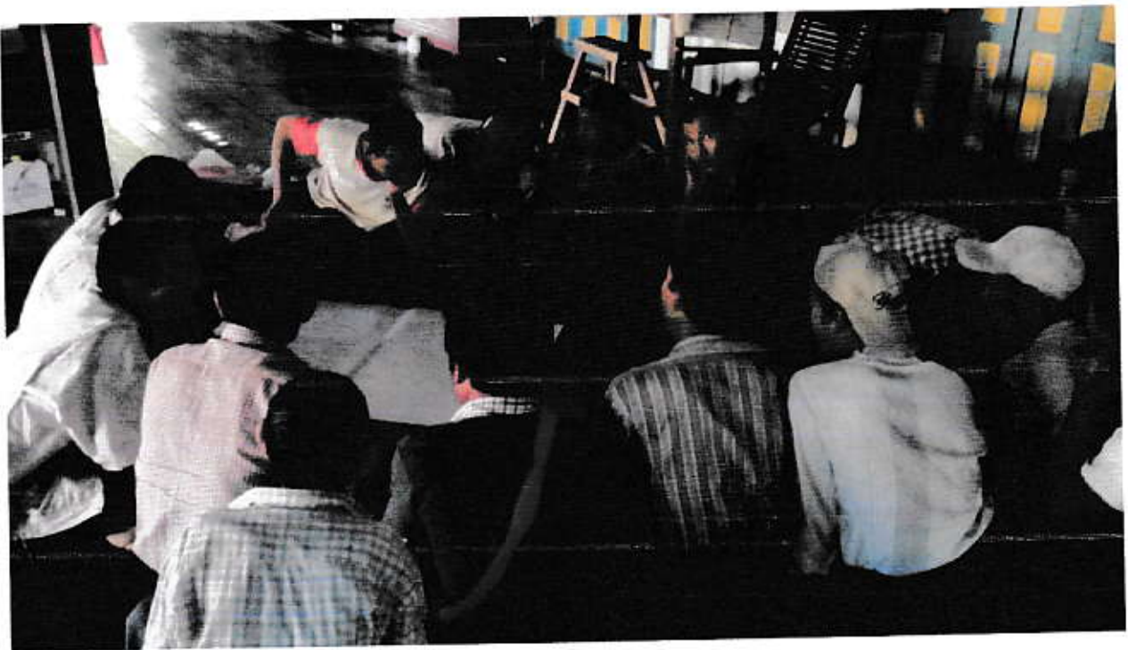
ရွာ၏ အပိဏဂုဏ်ဆိုင်နေရသော ဗြဟ္မနာ အခက်အခဲ များ အား ဆွေးနွေးနေ့ ဇွဲပုံ ( အမျိုးသား )