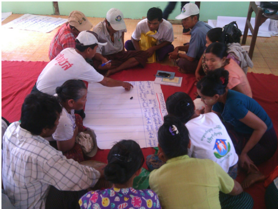
တောညိုကျေးရွာလူမှုဆန်းစစ်ခြင်းအစည်းအဝေးတွင်ကော်မတီဝင်များမှတက်ကြွစွာပူးပေါင်းပါဝင်ဆွေးနွေးနေကြစဉ်