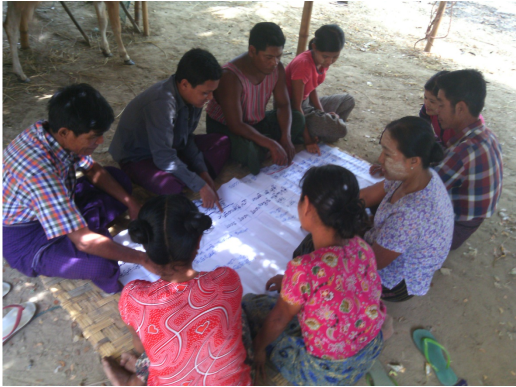
တောညိုကျေးရွာလူမှုဆန်းစစ်ခြင်းအစည်းအဝေးတွင်ကော်မတီဝင်များမှတက်ကြွစွာပူးပေါင်းပါဝင်ဆွေးနွေးနေကြစဉ်