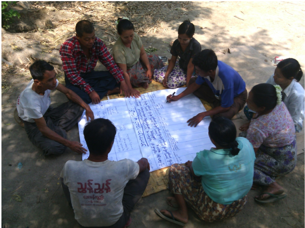
ကျောင်းစုရွာလူမှုဆန်းစစ်ခြင်းအစည်းအဝေးတွင်ကော်မတီဝင်များမှတက်ကြွစွာပူးပေါင်းပါဝင်ဆွေးနွေးနေကြစဉ်