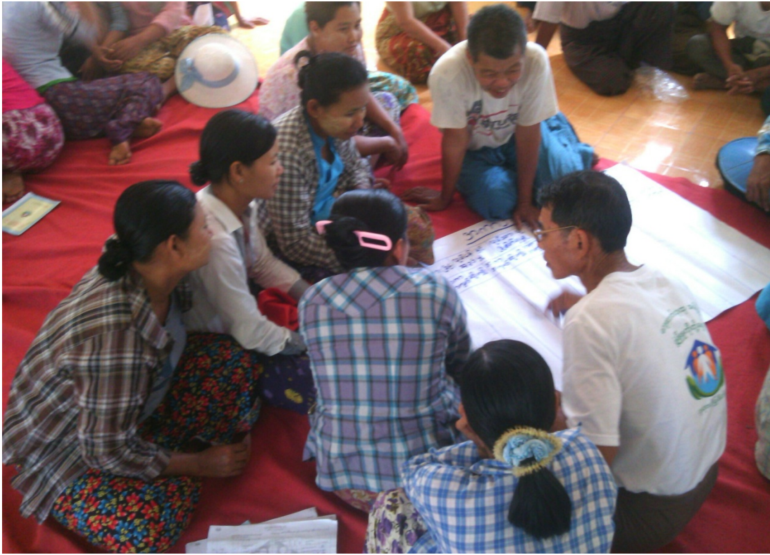
ကျောင်းစုရွာလူမှုဆန်းစစ်ခြင်းအစည်းအဝေးတွင်ကော်မတီဝင်များမှတက်ကြွစွာပူးပေါင်းပါဝင်ဆွေးနွေးနေကြစဉ်