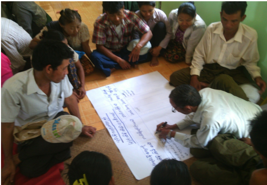
ကော့မူကျေးရွာလူမှုဆန်းစစ်ခြင်းအစည်းအဝေးတွင်ကော်မတီဝင်များမှတက်ကြွစွာပူးပေါင်းပါဝင်ဆွေးနွေးနေကြစဉ်