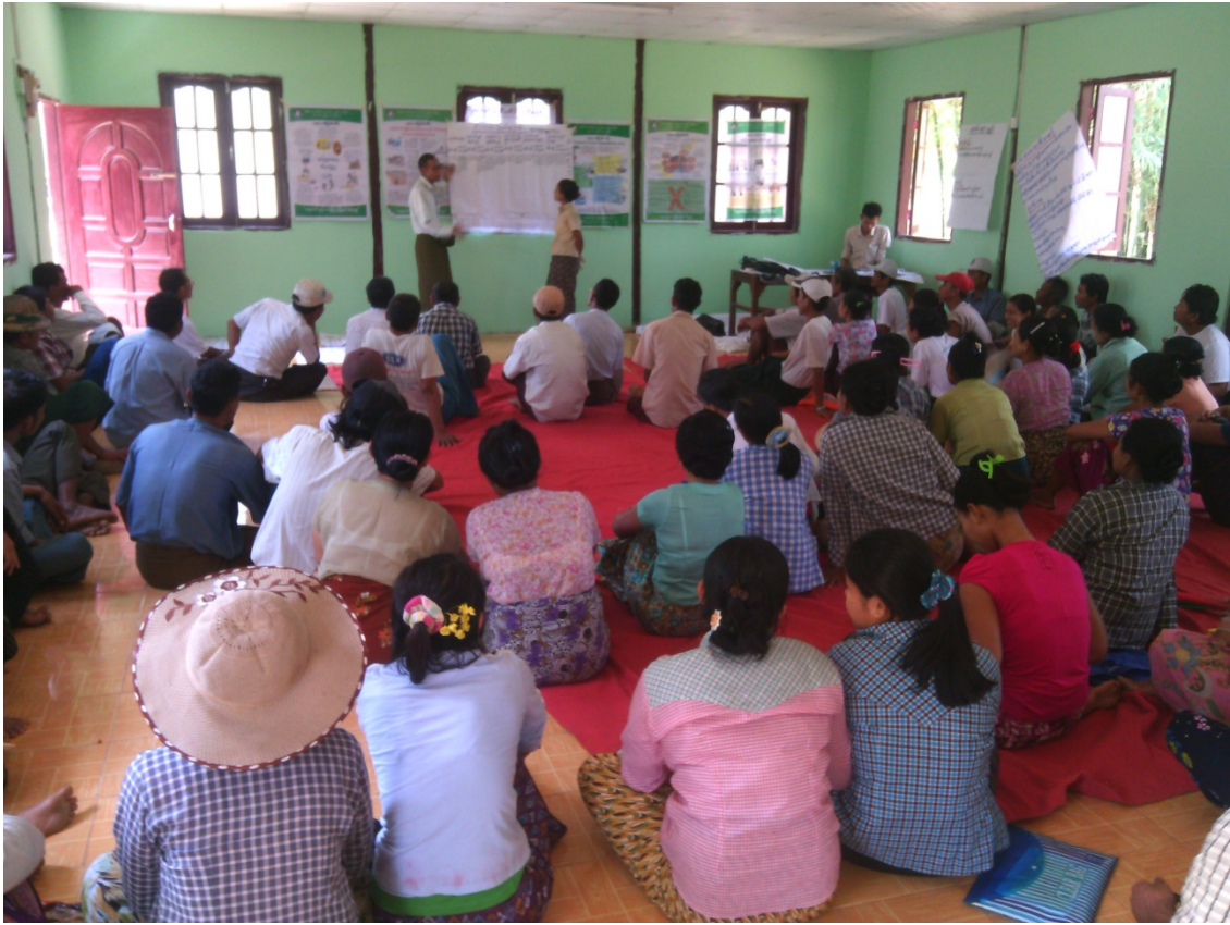
ကော့မူကျေးရွာလူမှုဆန်းစစ်ခြင်းအစည်းအဝေးတွင်ကော်မတီဝင်များမှတက်ကြွစွာပူးပေါင်းပါဝင်ဆွေးနွေးနေကြစဉ်