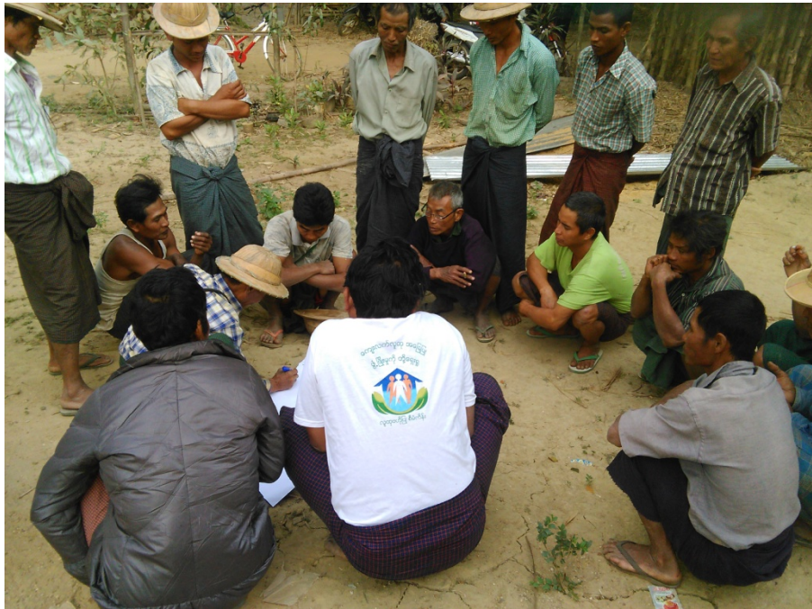
အိုင်ကြီး၊အိုင်လေးကျေးရွာလူမှုဆန်းစစ်ခြင်းအစည်းအဝေးတွင်ကော်မတီဝင်များမှတက်ကြွစွာပူးပေါင်းပါဝင်ဆွေးနွေးနေကြစဉ်