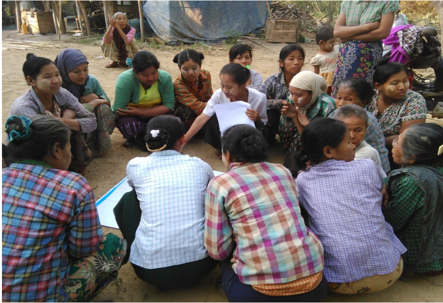
အိုင်ကြီး၊အိုင်လေးကျေးရွာလူမှုဆန်းစစ်ခြင်းအစည်းအဝေးတွင်ကော်မတီဝင်များမှတက်ကြွစွာပူးပေါင်းပါဝင်ဆွေးနွေးနေကြစဉ်