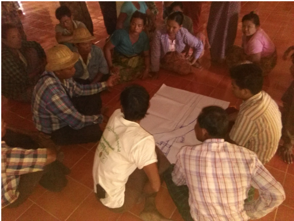
အုတ်ဖိုကျေးရွာလူမှုဆန်းစစ်ခြင်းအစည်းအဝေးတွင်ကော်မတီဝင်များမှတက်ကြွစွာပူးပေါင်းပါဝင်ဆွေးနွေးနေကြစဉ်