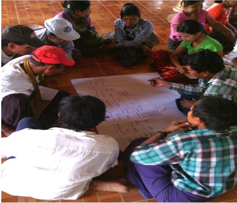
အုတ်ဖိုကျေးရွာလူမှုဆန်းစစ်ခြင်းအစည်းအဝေးတွင်ကော်မတီဝင်များမှတက်ကြွစွာပူးပေါင်းပါဝင်ဆွေးနွေးနေကြစဉ်