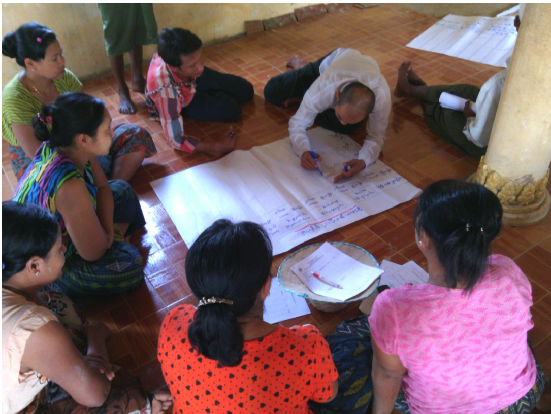
ကြို့ကုန်းကျေးရွာလူမှုဆန်းစစ်ခြင်းအစည်းအဝေးတွင်ကော်မတီဝင်များမှတက်ကြွစွာပူးပေါင်းပါဝင်ဆွေးနွေးနေကြစဉ်