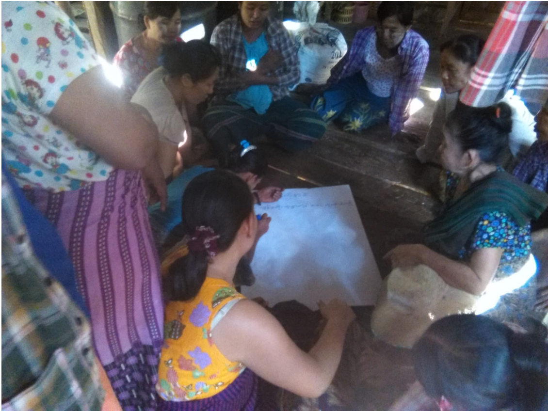
ကြို့ကုန်းကျေးရွာလူမှုဆန်းစစ်ခြင်းအစည်းအဝေးတွင်ကော်မတီဝင်များမှတက်ကြွစွာပူးပေါင်းပါဝင်ဆွေးနွေးနေကြစဉ်