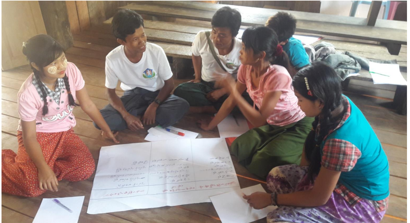
၇။ ကော်မတီဝင်များရွေးချယ်ခြင်းနှင့် ကျေးရွာဖွံ့ဖြိုးရေးအစီအစဉ်ဆောင်ရွက်မှုမှတ်တမ်းခါတ်ပုံများ