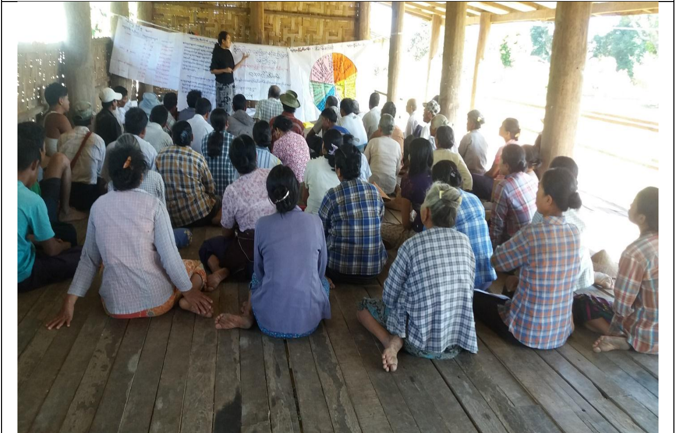
ကော်မတီရွေးချယ်ခြင်း မှတ်တမ်းဓါတ်ပုံ