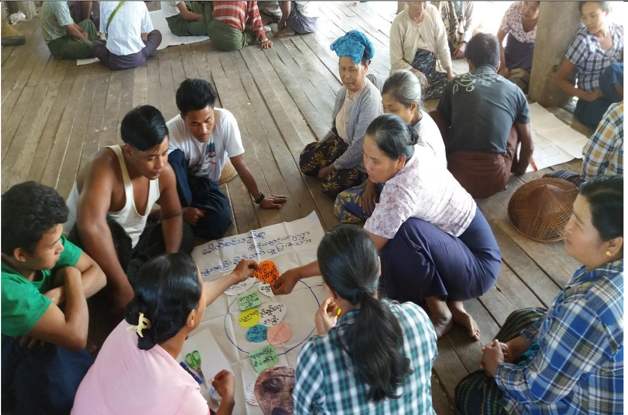
အမျိုးသား/အမျိုးသမီးအုပ်စုမှတ်တမ်းခါတ်ပုံ