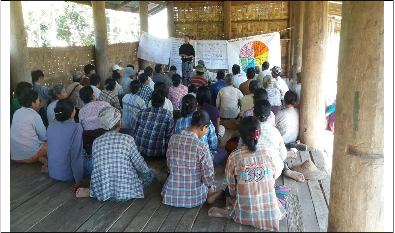
စေတနာ့ဝန်ထမ်းများ ရွေးချယ်ခြင်း မှတ်တမ်းဓါတ်ပုံ