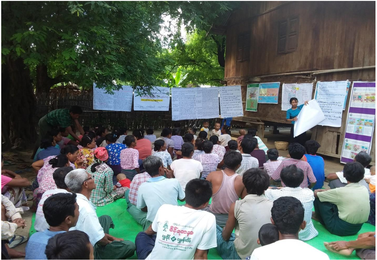
စည်းရုံးရေးမှူးများမှ စီမံကိန်းအကြောင်းမိတ်ဆက်ရှင်းလင်းနေပုံ