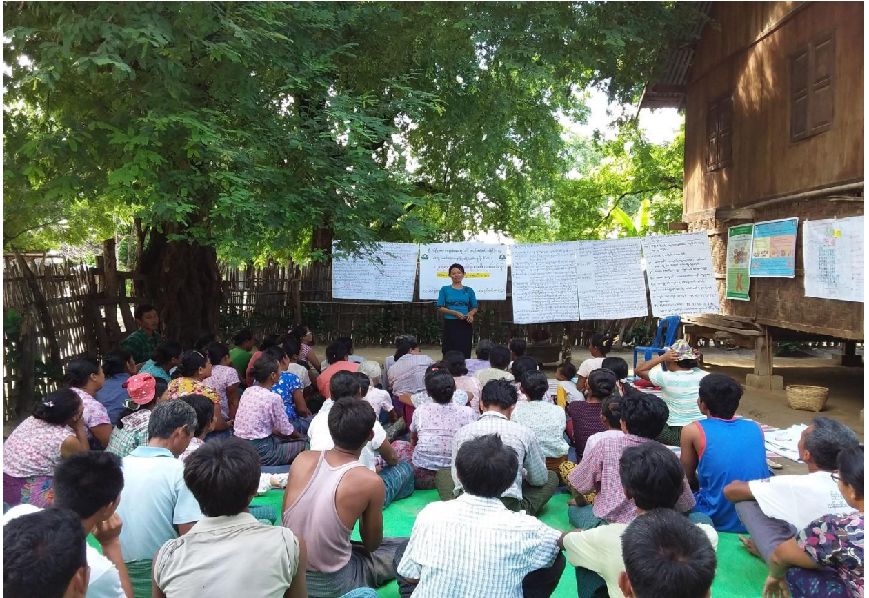
ပထမအကြိမ် ကျေးရွာစီမံကိန်းမိတ်ဆက်အစည်းအဝေးဆောင်ရွက်နေပုံ