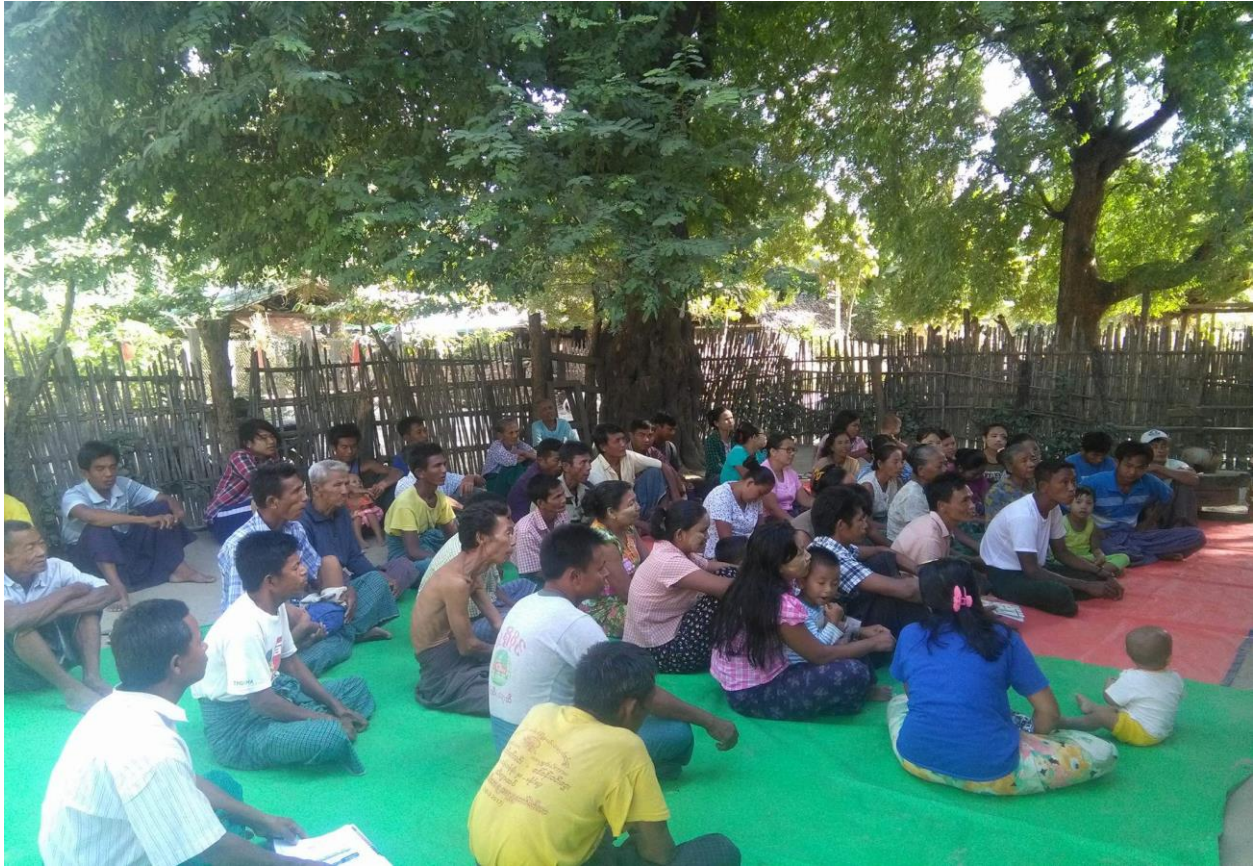
လုပ်ငန်းခွဲအသိပေးခြင်းအစည်းအဝေးအား ကျေးရွာလူထုမှ တက်ရောက်ဆွေးနွေးနေပုံ