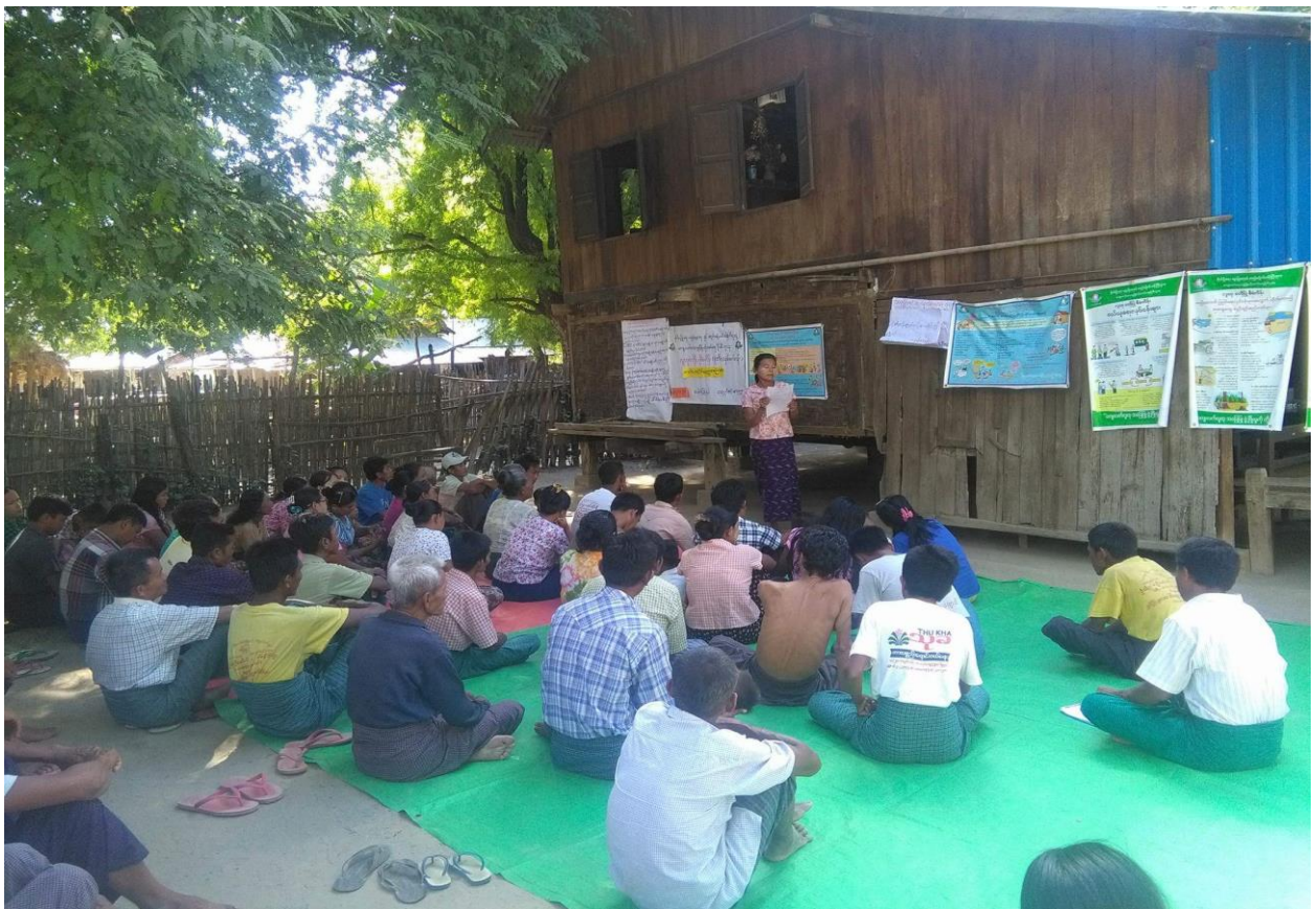
လုပ်ငန်းခွဲအသိပေးခြင်းအစည်းအဝေးအား ကျေးရွာလူထုမှ တက်ရောက်ဆွေးနွေးနေပုံ