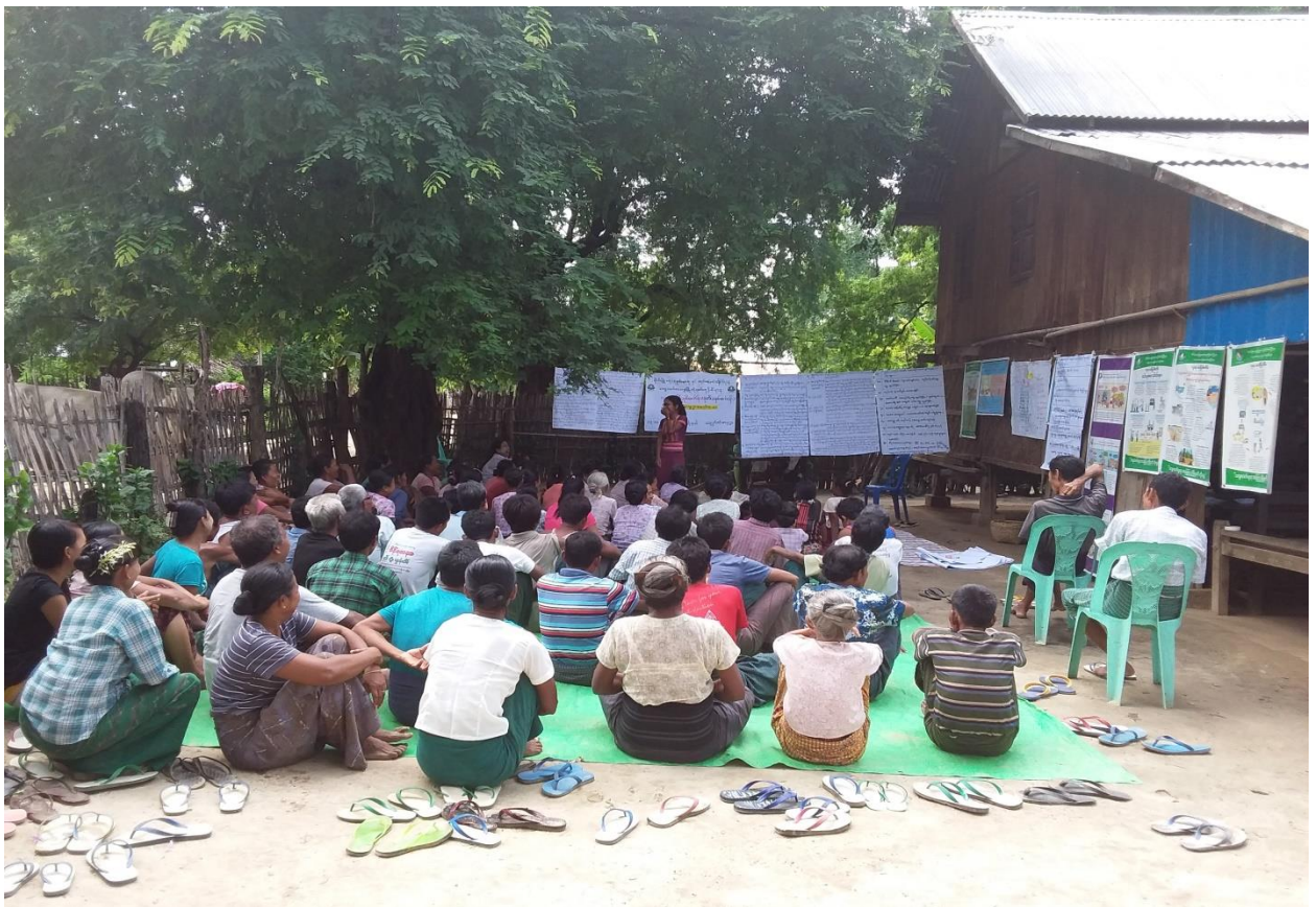
စည်းရုံးရေးမှူးများမှ စီမံကိန်းအကောင်း မိတ်ဆက်ရှင်းလင်းနေပုံ