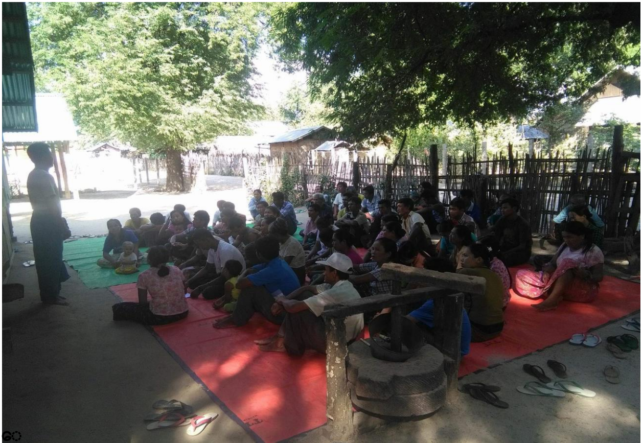
လုပ်ငန်းခွဲအသိပေးခြင်းအစည်းအဝေးအား အုပ်ချုပ်ရေးမှူးမှ တက်ရောက်ဆွေးနွေးနေပုံ