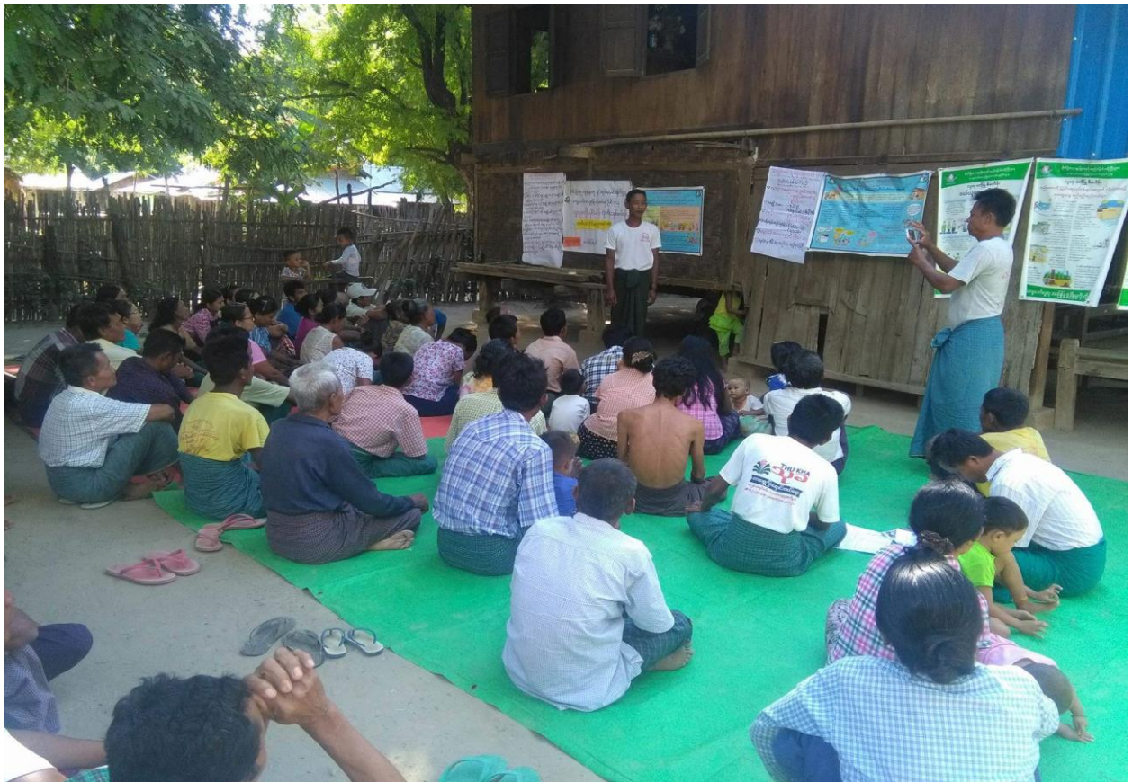
လုပ်ငန်းခွဲအသိပေးခြင်းအစည်းအဝေးအား ကျေးရွာလူထုမှ တက်ရောက်ဆွေးနွေးနေပုံ