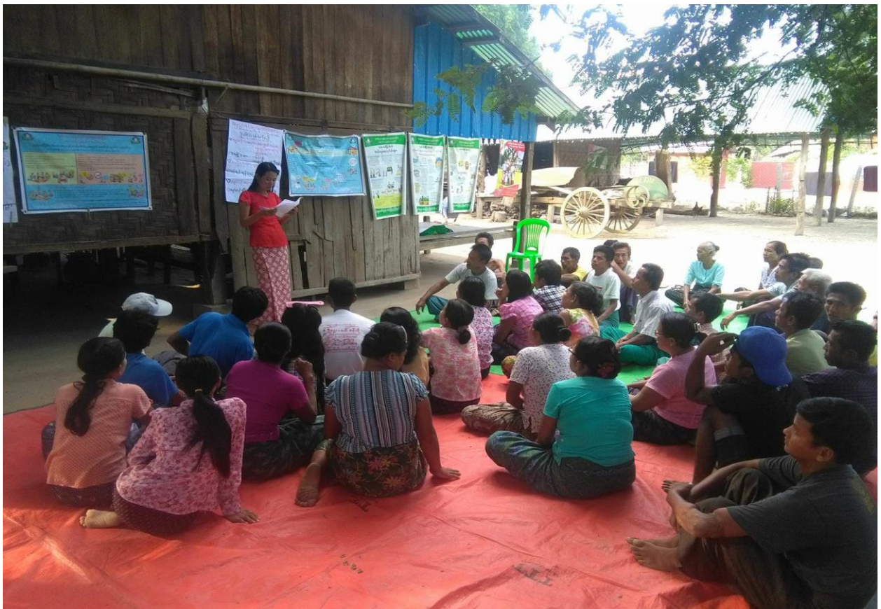
ကျေးရွာစီမံကိန်းလုပ်ငန်းခွဲအား ကျေးရွာလူထုသို့ အသိပေးအကြောင်းကြားနေပုံ