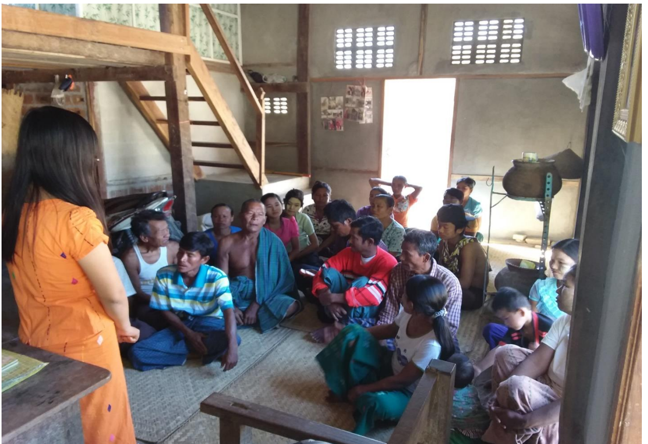
လက်ထောက်နည်းပညာမှူး ဒေါ်အိအိစိုးမှ စီမံကိန်းအကြောင်းရှင်းပြနေပုံ