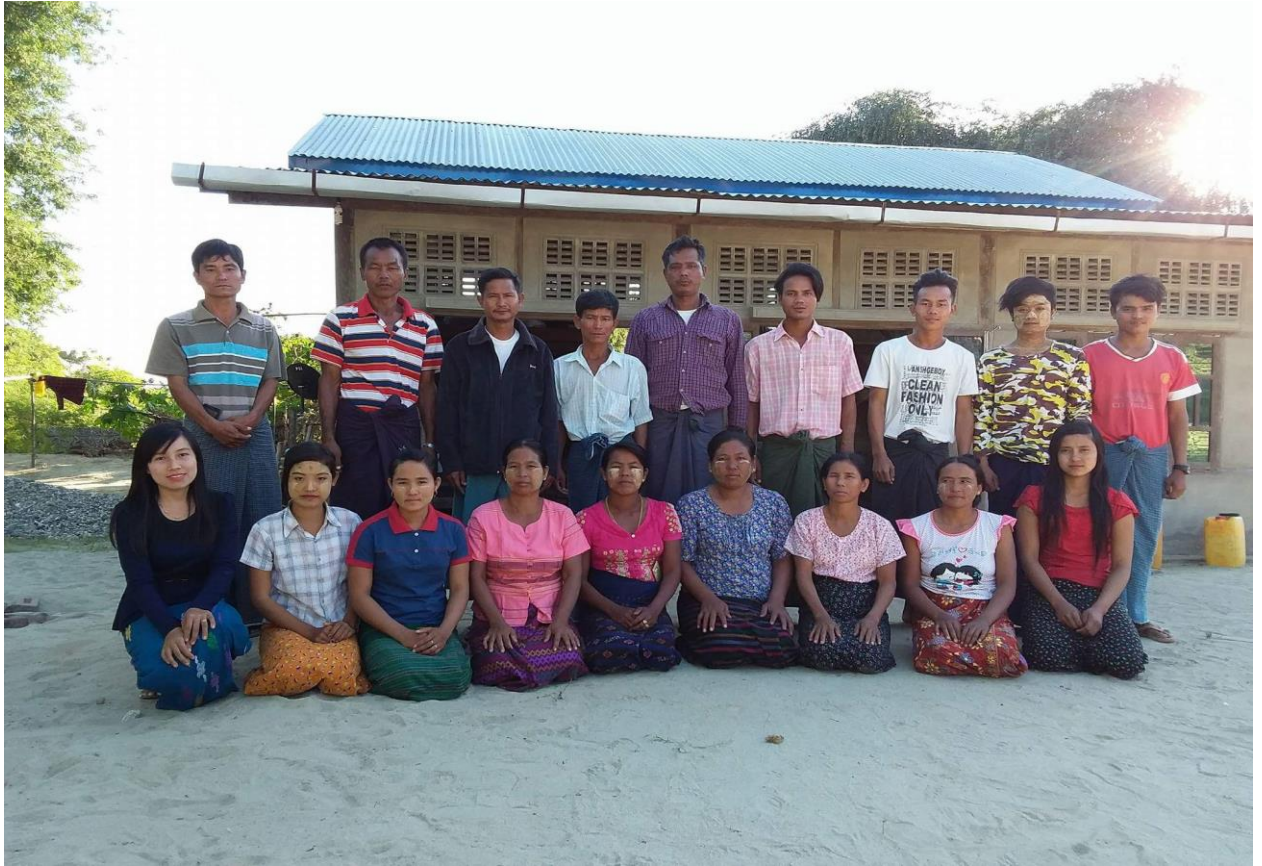
ကျေးရွာလူထုမှ မဲပေးရွေးချယ်ထားသော ကျေးရွာစီမံခန့်ခွဲမှုကော်မတီဝင်များ မှတ်တမ်းဓာတ်ပုံ