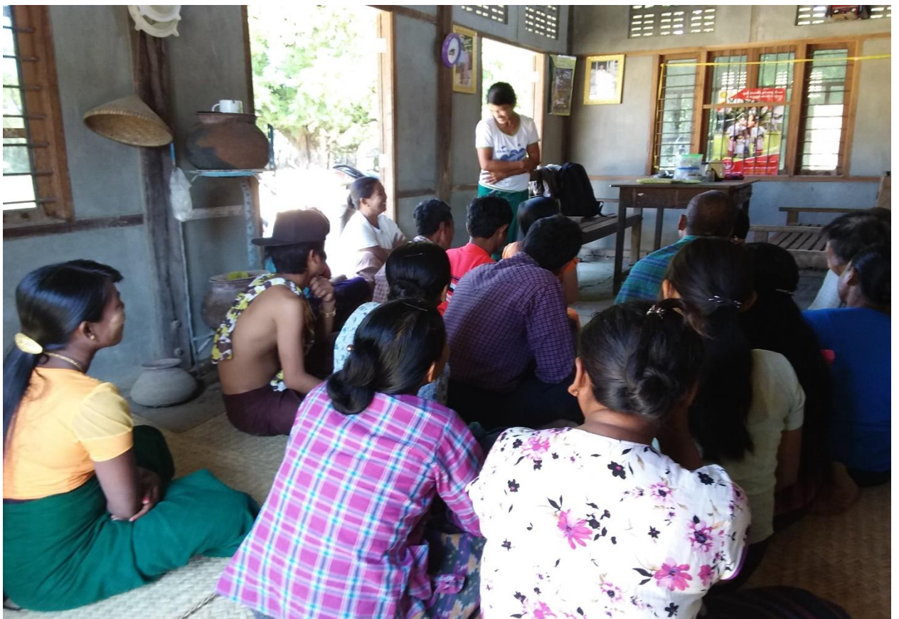
အမျိုးသမီးများမှ အစည်းအဝေးတွင် တက်ကြွစွာ ပါဝင်ဆွေးနွေးနေပုံ