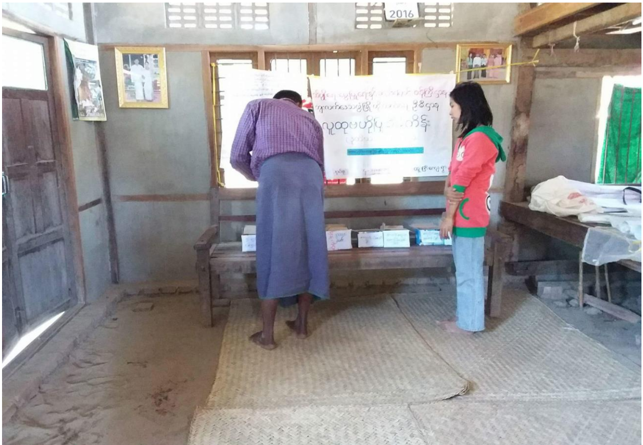
ကျေးရွာဖွံ့ဖြိုးရေးလုပ်ငန်းစဉ်များအား မဲပေးရွေးချယ်နေပုံ