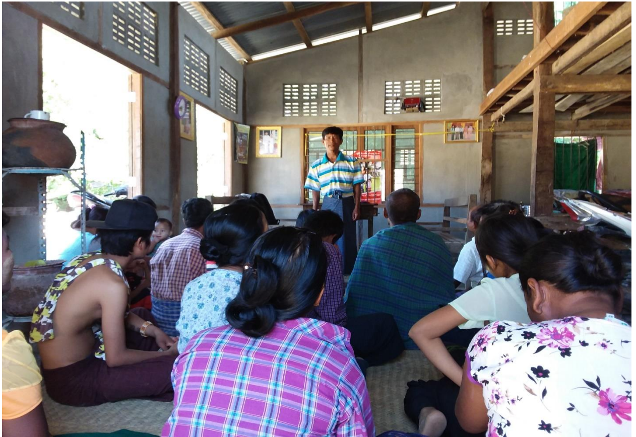
အမျိုးသားများမှ အစည်းအဝေးအား တက်ကြွစွာပါဝင်ဆွေးနွေးနေပုံ