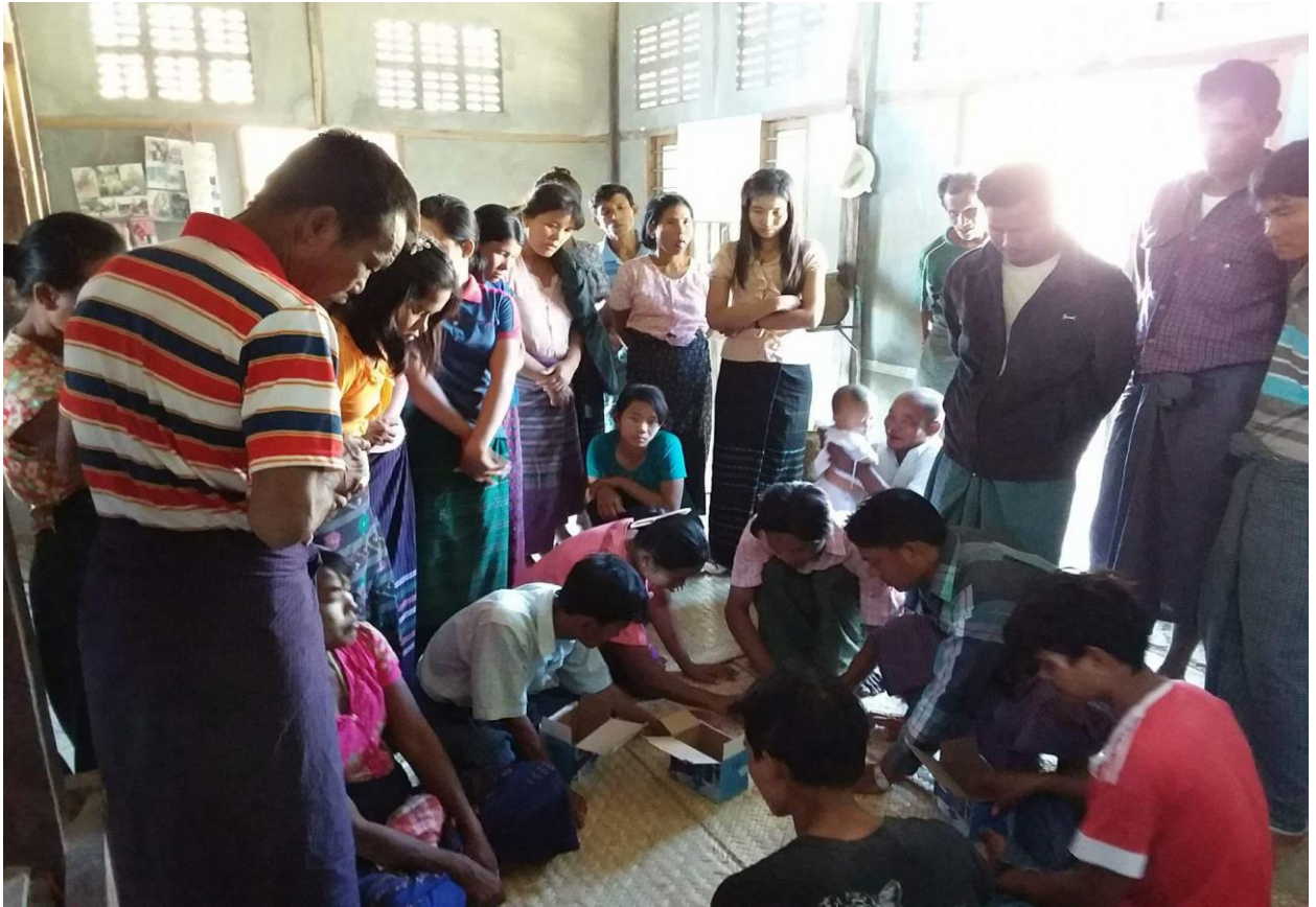
ကျေးရွာလူထုမှ စီမံကိန်းလုပ်ငန်းခွဲများအပေါ် မဲပေးထားမှုများအား ရေတွက်နေပုံ