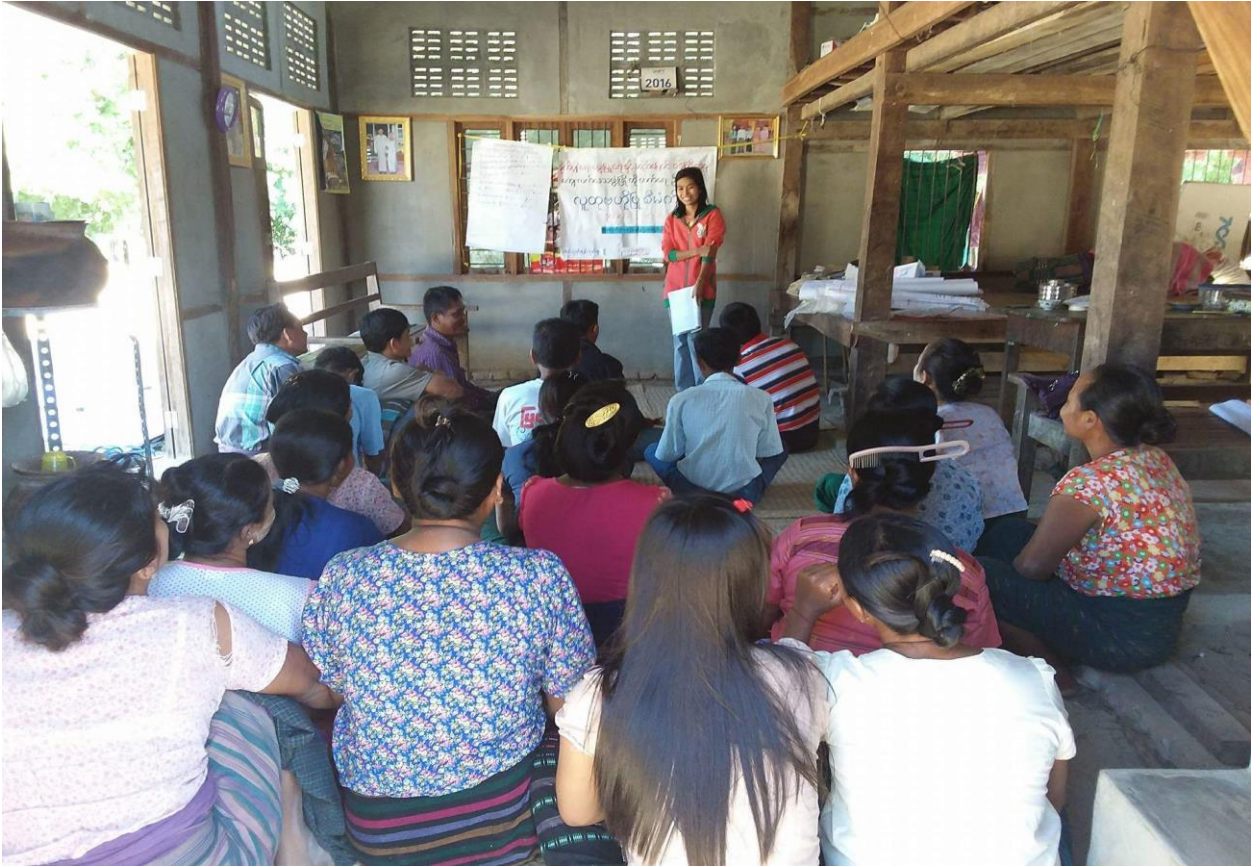
ဒုတိယအကြိမ် ကျေးရွာဖွံ့ဖြိုးရေးစီမံကိန်းရေးဆွဲခြင်းအစည်းအဝေး ဆောင်ရွက်နေပုံ