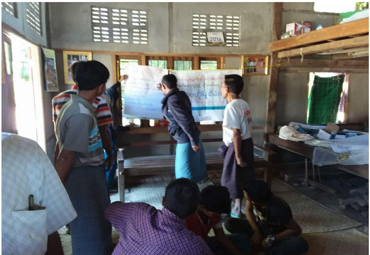
ဦးစားပေးဖွံ့ဖြိုးရေးလုပ်ငန်းများ ရွေးချယ်ပြီးစီးမှုအား ပြန်လည်ချပြနေပုံ