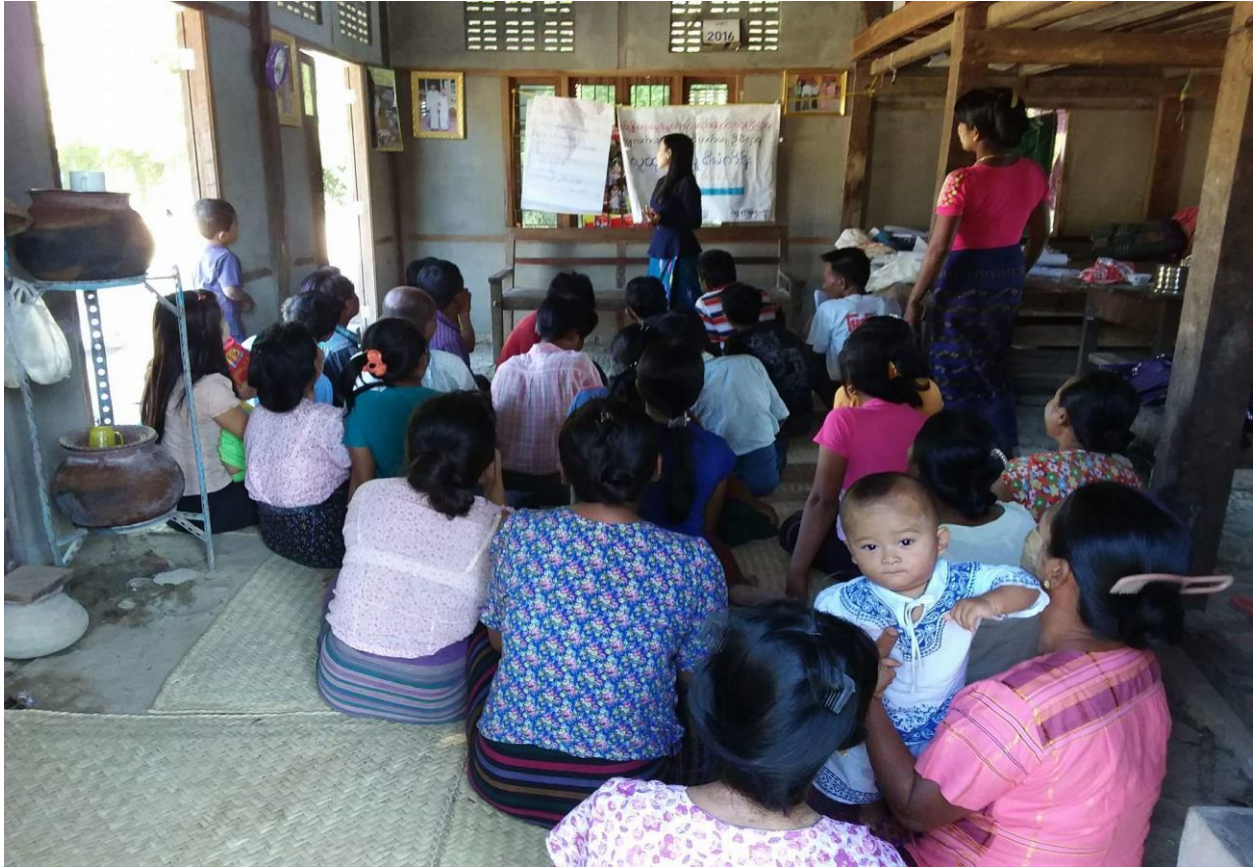
ကျေးရွာလူထုမှ စီမံကိန်းအကြောင်း တက်ကြွစွာပါဝင်ဆွေးနွေးနေပုံ