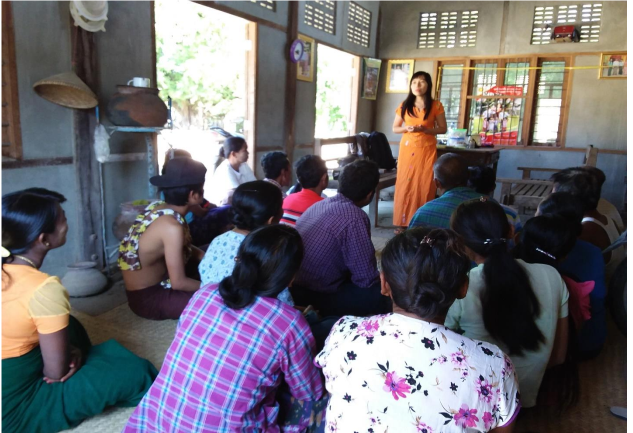
ပထမအကြိမ် ကျေးရွာစီမံကိန်းမိတ်ဆက်အစည်းအဝေးဆောင်ရွက်နေပုံ