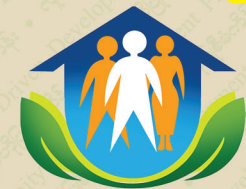
Mvngpòng Mvdònggòl Rvmánzóng

Kvtlím, Rimlím nùng Tìkùng Wunjí Ràlìng Rìngzì Rvgaq Vháng Vlúnlím Øpshøl Ràlìng